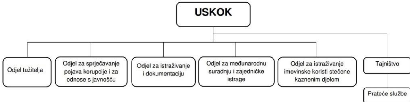
Slika 2: Ustroj