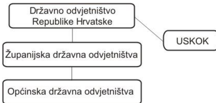
Slika 1: Ustroj državnog odvjetništva