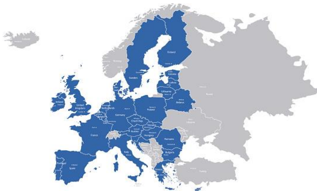
Slika 1. Države članice Europske unije