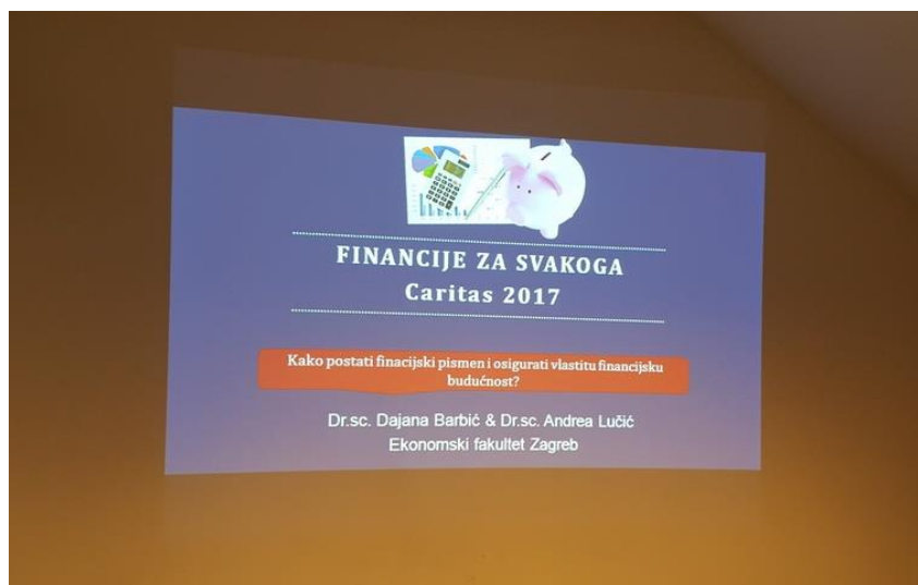
Slika 5. Radionica „Upravljanje financijama“

Planira se da će 100 korisnika proći ove radionice. Svaki će polaznik potpisom evidencijske liste.