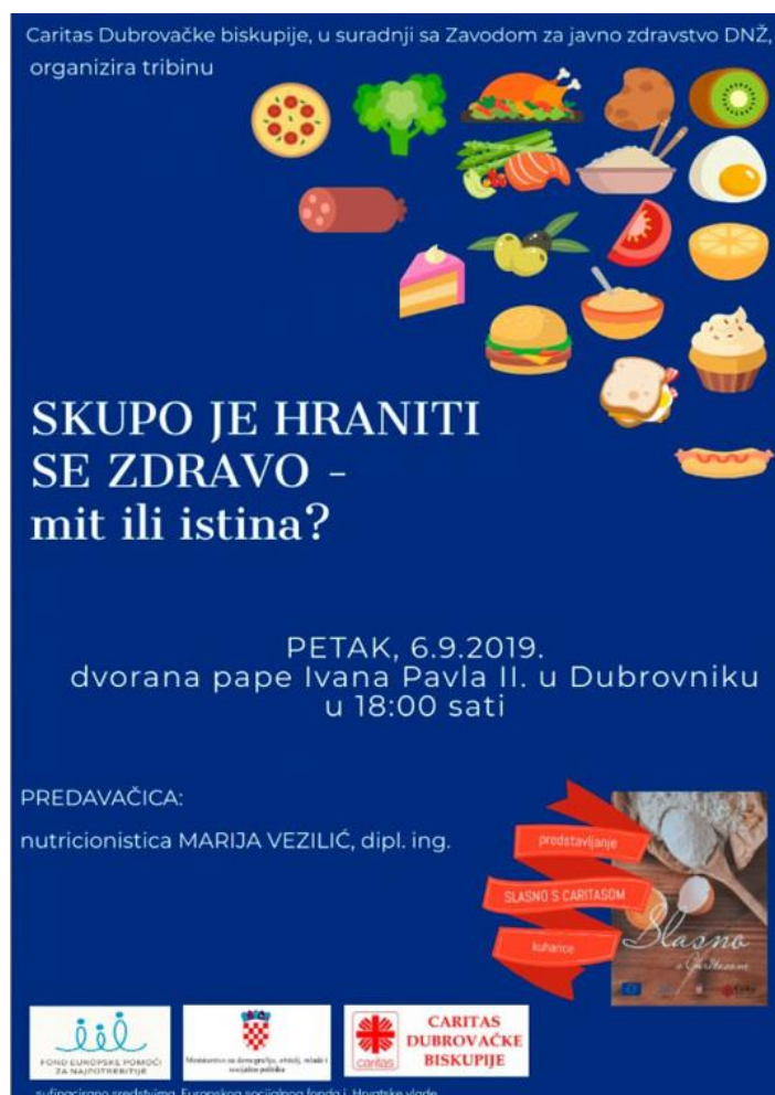
Slika 6. plakat Skupo je hraniti se zdravo- mit ili istina?