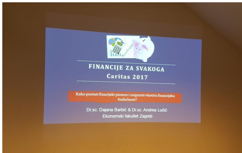
Slika 5. Radionica „Upravljanje financijama“

Planira se da će 100 korisnika proći ove radionice. Svaki će polaznik potpisom evidencijske liste.