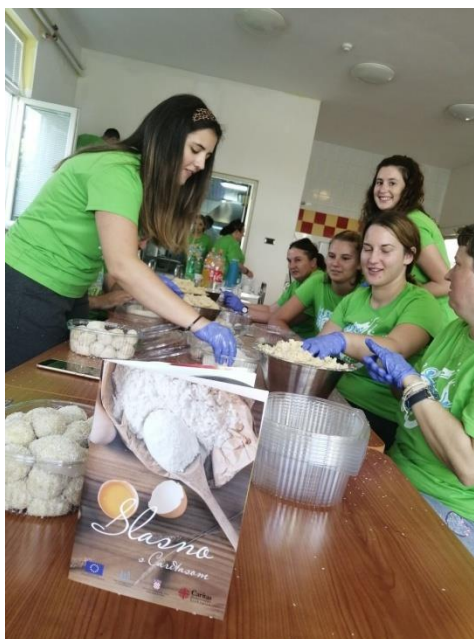
Slika 7. Kuharica „Slasno s Caritasom“