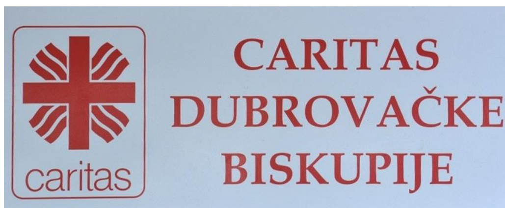
Slika 4. Logo Caritasa

Caritas Dubrovačke biskupije je neprofitna organizacija koja nije obveznik PDV-a. Sukladno čl. 14. Zakona o humanitarnoj pomoći Caritas Dubrovačke biskupije je nositelj rješenja kojim se odobrava prikupljanje i pružanje humanitarne pomoći.