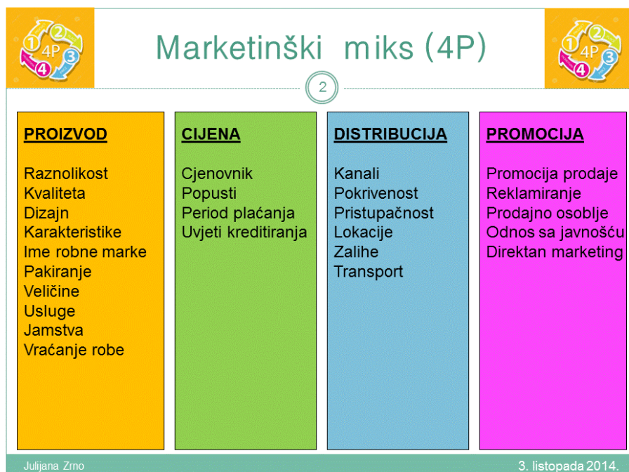
Slika 3. 4P Marketing mix