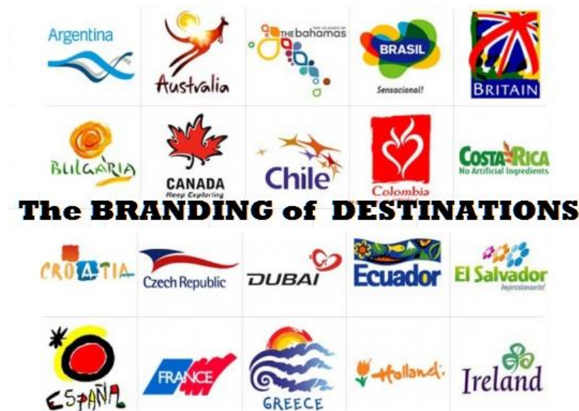
Slika 4. Marke turističkih destinacija