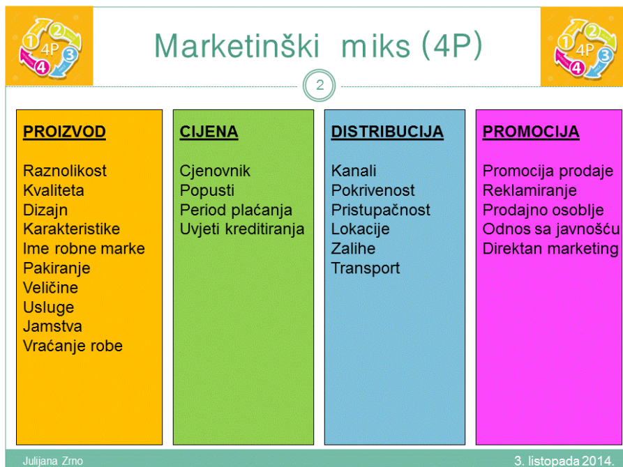
Slika 3. 4P Marketing mix