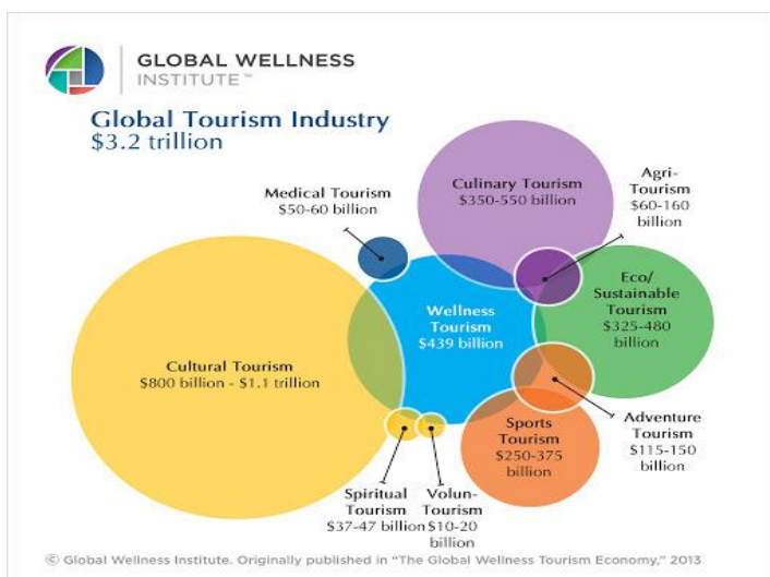
Slika 2. Prikaz turističke industrije

Izvor: http://www.enterprisebydesign.ac.uk/ebd18-velocity/sales-wales-wellness-week/attachment/gwi_globaltourismindustry_hires/ str. 1. [04.07.2020]