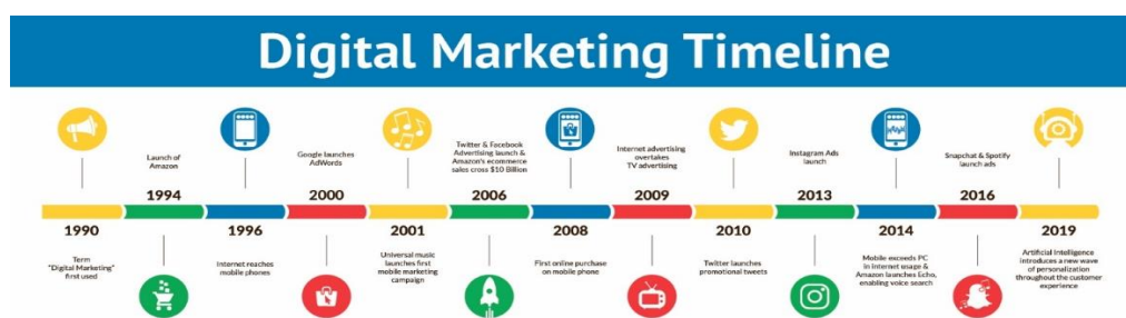
Slika 1. Vremenska crta Digitalnog marketinga