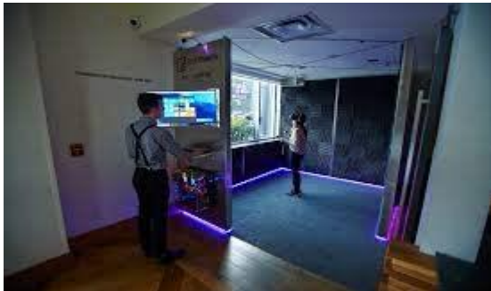
Slika 6. Soba VR u hotelu „ZETTA“