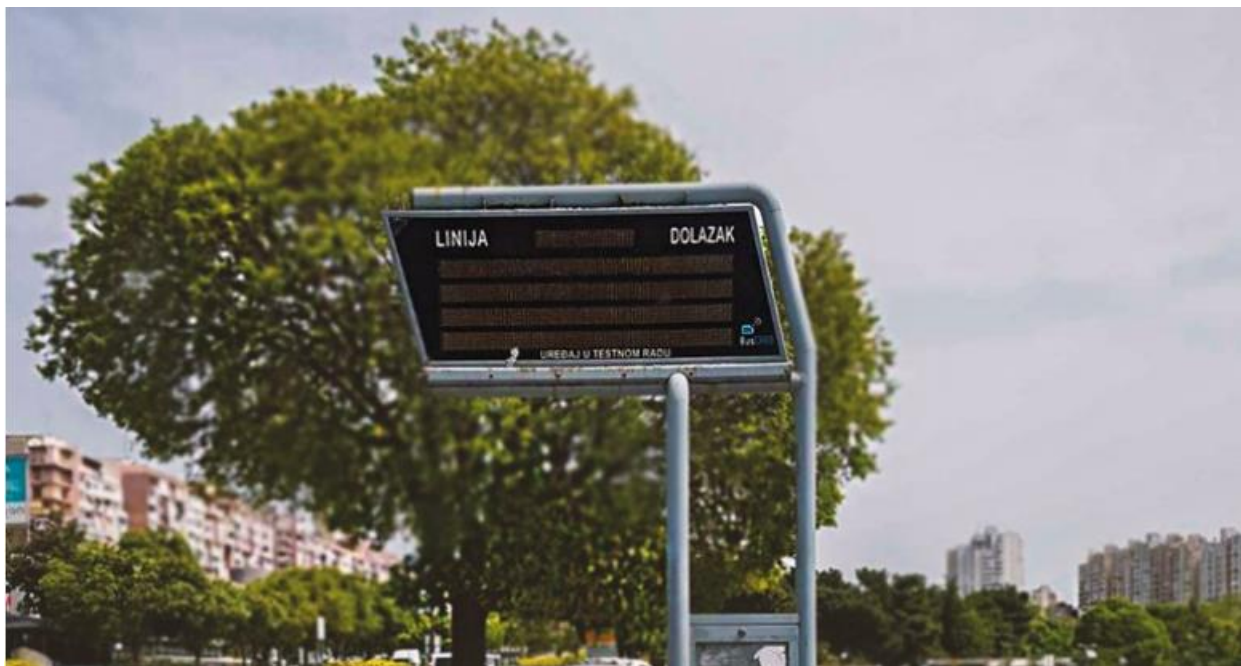
Slika 4 : Neispravni stanični displej