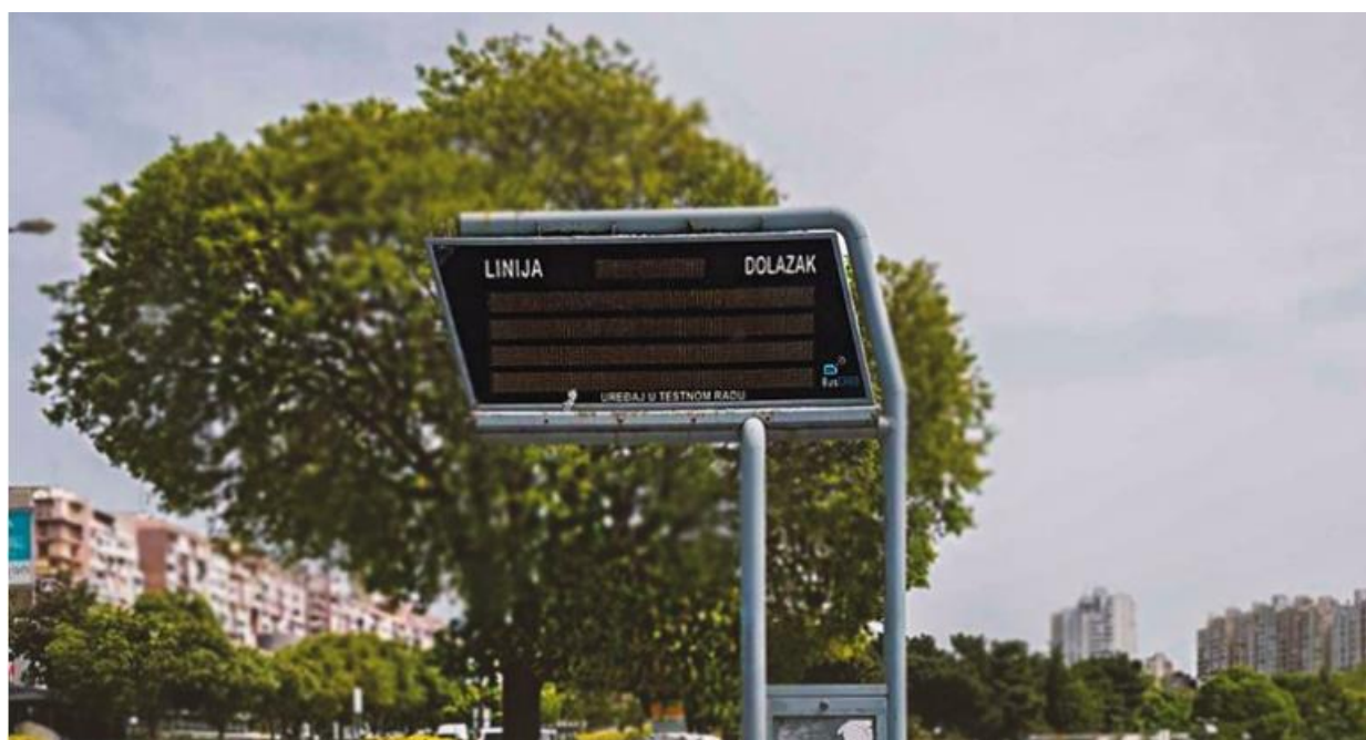
Slika 4 : Neispravni stanični displej