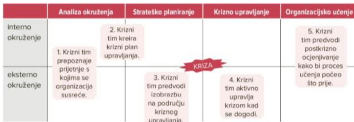
Slika 1: Krizni tim tokom odvijanja krizne situacije