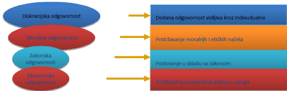
Slika 1. Razine odgovornosti

Izvor: Levels of Entrepreneurial responsibility Wickham,P.A., Strategic Entrepreneurship, FT Prentice Hall,Harlow, 2006, str. 199. 18