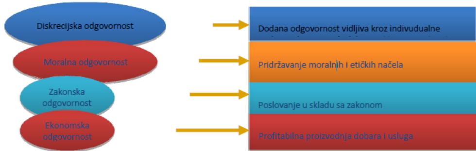
Slika 1. Razine odgovornosti

Izvor: Levels of Entrepreneurial responsibility Wickham,P.A., Strategic Entrepreneurship, FT Prentice Hall,Harlow, 2006, str. 199. 18