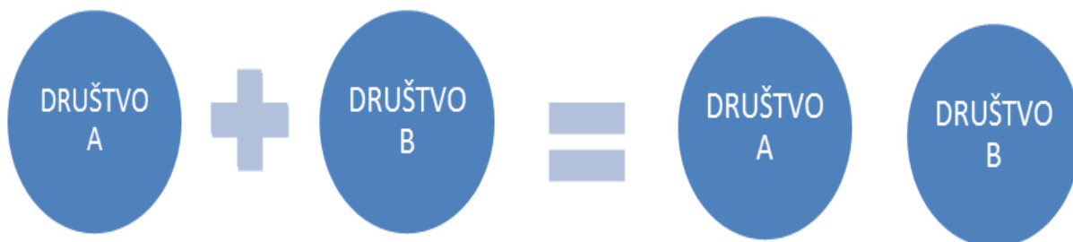
Slika 3 Grafički prikaz povezivanja