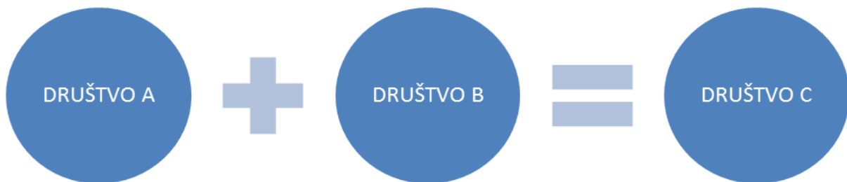
Slika 2 Grafički prikaz spajanja