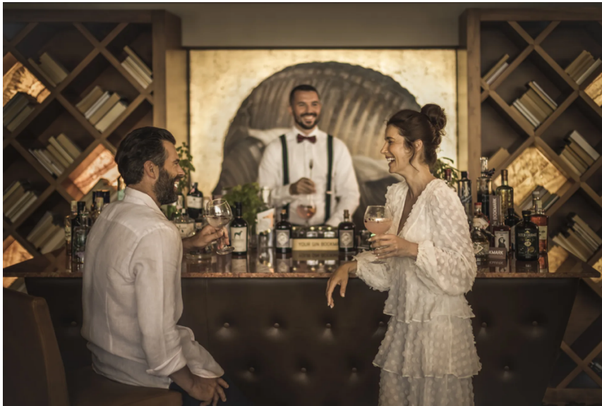
Slika 17 Bar u hotelu za odrasle