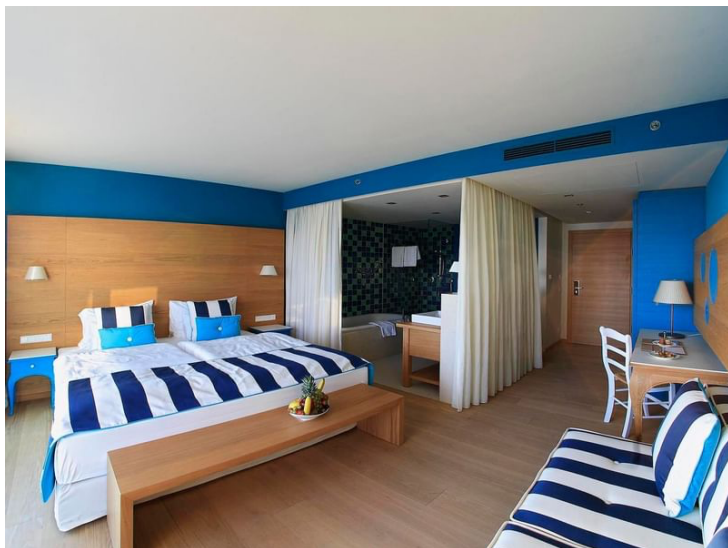
Slika 15 Hotelska soba