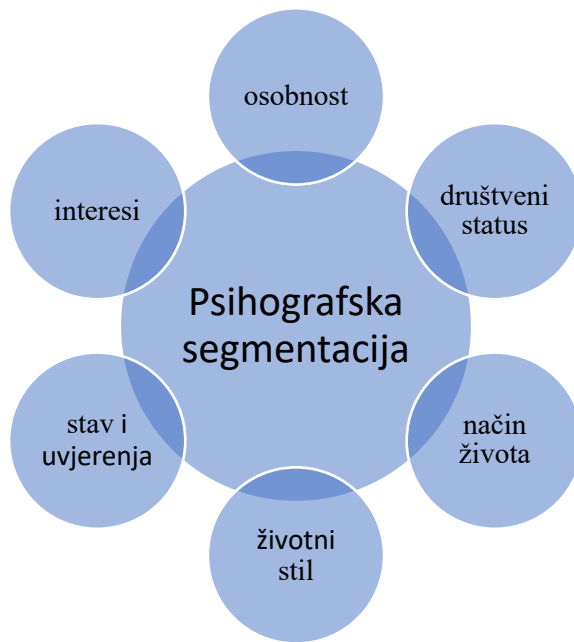
Slika 6 Obilježja psihografske segmentacije