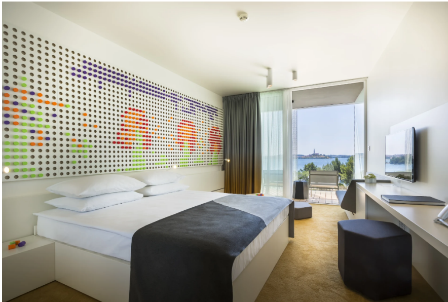
Slika 11 Soba u hotelu Amarin