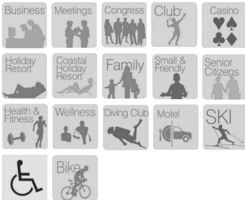
Slika 8 Vrste hotela