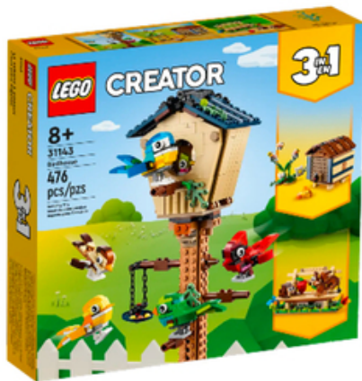
Slika 3 Primjer Lego igračaka segmentiranih za djecu