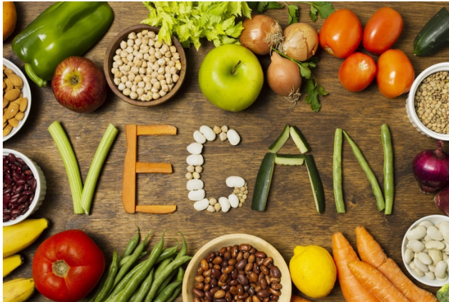
Slika 4 Trend veganstva

Izvor 4 http://fitlavia.sk/co-je-veganstvo-a-kto-je-vegan/ (20.08.2024.)