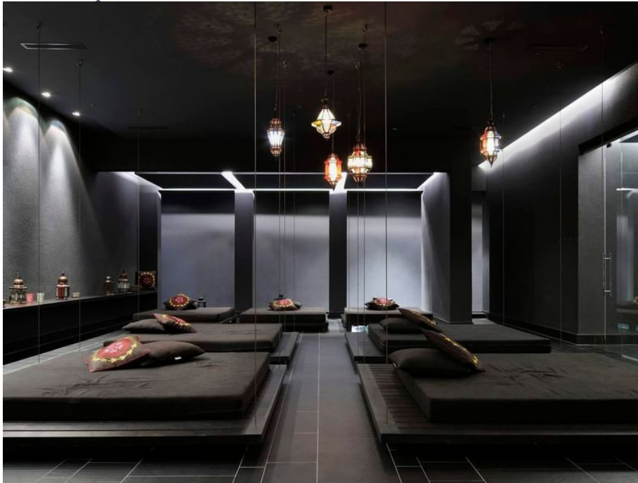
Slika 14 Spa soba