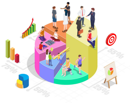
Slika 1: Segmentacija tržišta