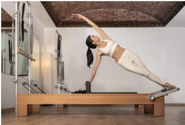
Slika 5 Trend pilatesa