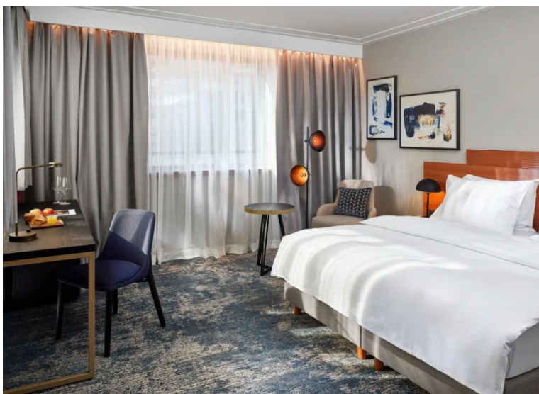
Slika 9 Hotelska soba u business hotelu