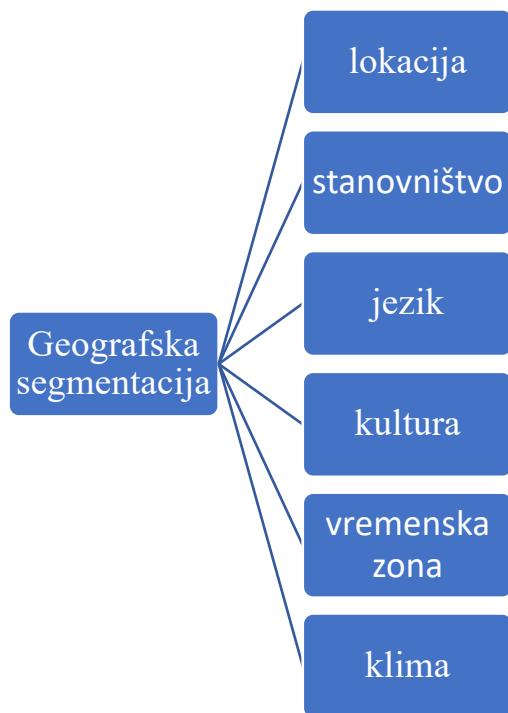
Slika 7 Obilježja geografske segmentacije