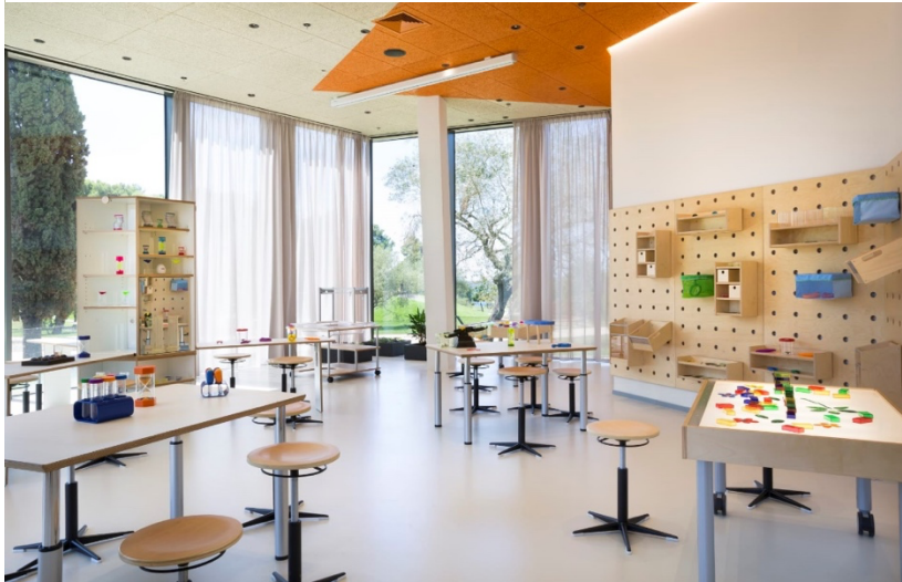
Slika 12 Dječja igraonica u family hotelu