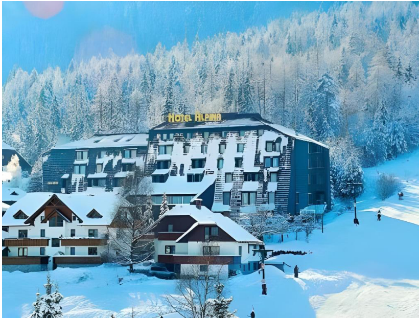
Slika 16 Ski hotel u Sloveniji