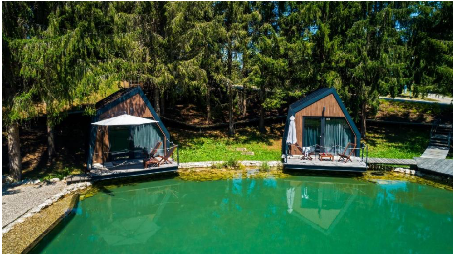
Slika 13 Smještaj u resortu