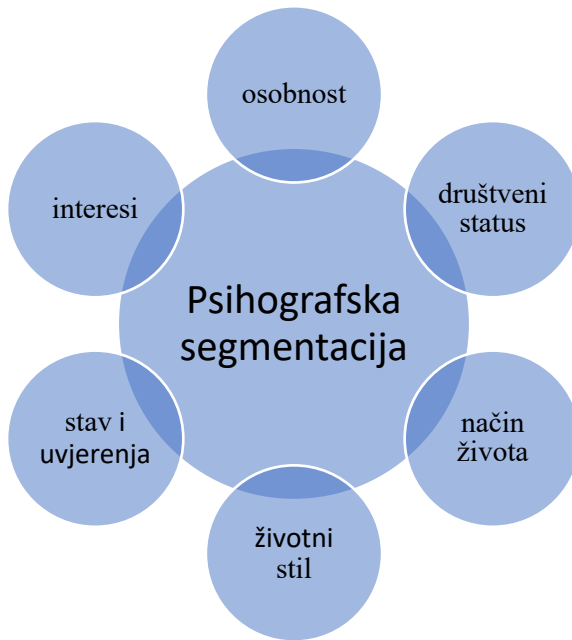
Slika 6 Obilježja psihografske segmentacije