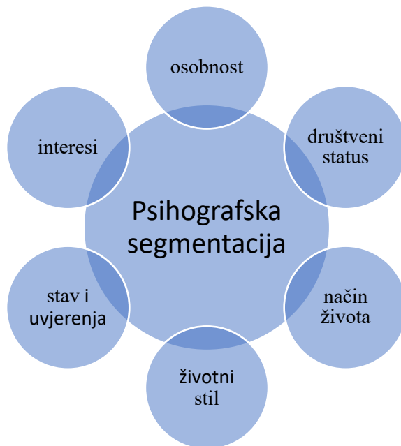
Slika 6 Obilježja psihografske segmentacije

Izvor 6 Izrada autora prema: Previšić, J. (2004.) Marketing . Zagreb: ADVERTA d.o.o.