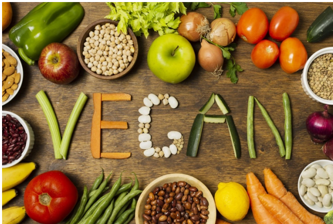
Slika 4 Trend veganstva