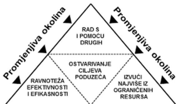
Slika 1. Ključni aspekti menadžerskog procesa

Izvor: Buble M. (2003.), Management maloga poduzeća, Ekonomski fakultet Split, str. 5.