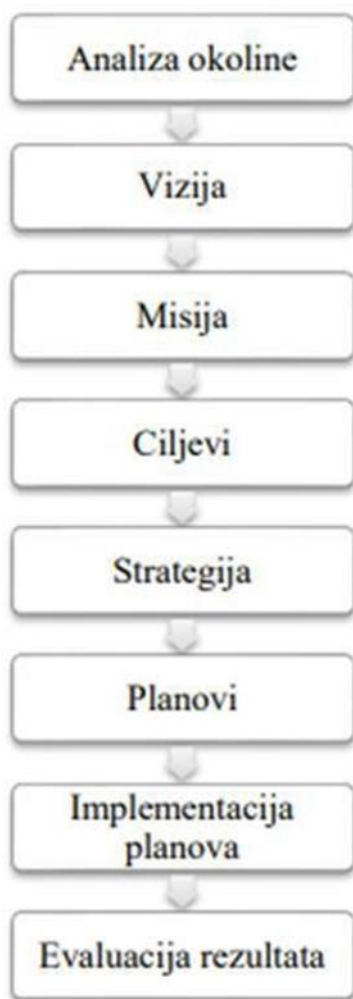
Slika 3. Proces planiranja