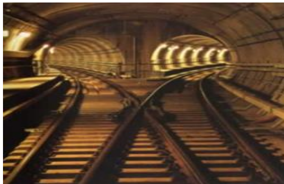
Slika 8. Korozija lutajuće struje u tunelu [9]