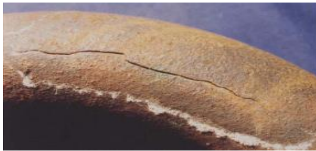
Slika 9. Primjer napetosne korozije ugljičnog čelika – interkristalni karakter loma [10]