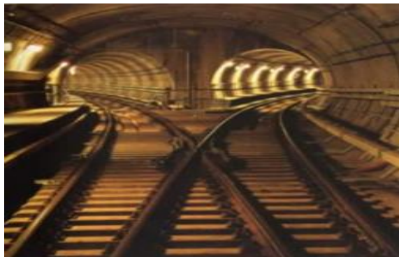
Slika 8. Korozija lutajuće struje u tunelu [9]