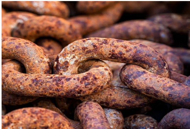
Slika 1. Atmosferska korozija [2]