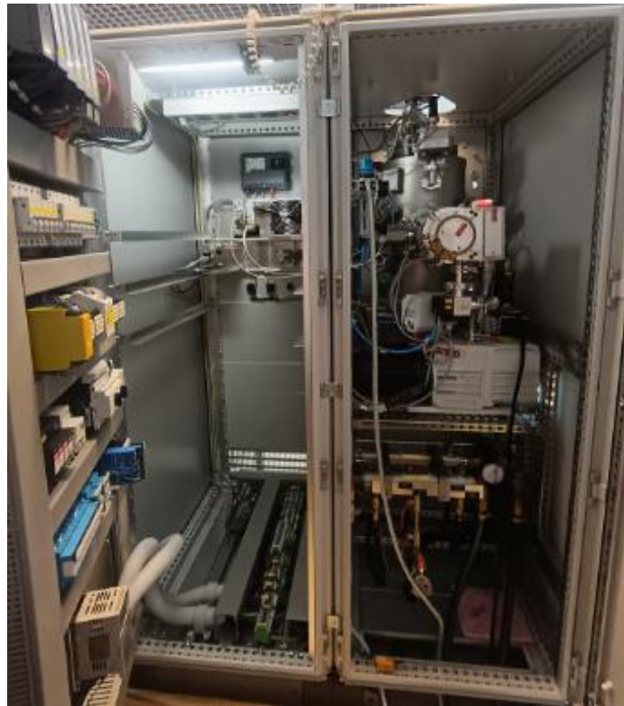
Slika 15. Prikaz strukture stražnje strane uređaja za magnetronsko raspršenje [17]