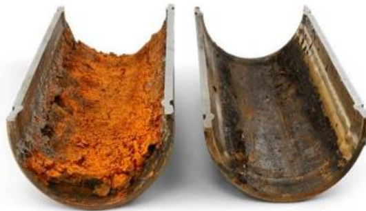
Slika 4. korozija u neelektrolitičkoj tekućini- nafti [5]

Primjer neelektrolitičkih tekućina: organska otapala, ulje i goriva (nafta, dizel i drugi oblici goriva i ulja), tekućine koje sadrže otopljene kiseline ili baze, sintetičke tekućine i polimeri. Primjer korozije u neelektrolitičkoj tekućini, odnosno nafti prikazano je na slici 4.