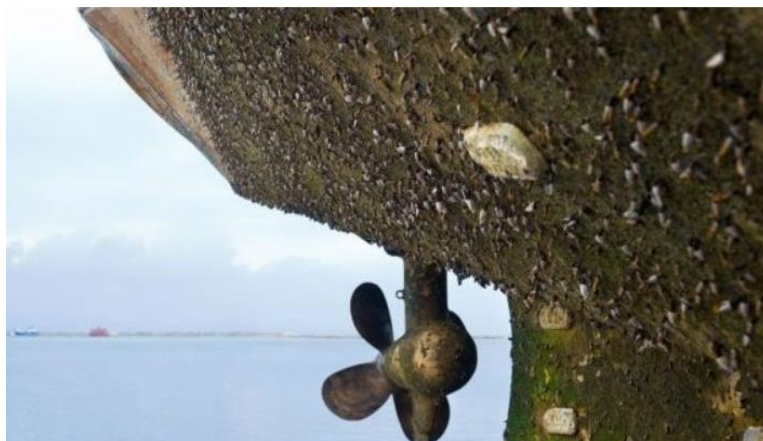
Slika 10. Primjer biokorozije – obraštaj podvodnog dijela brodskog trupa [11]