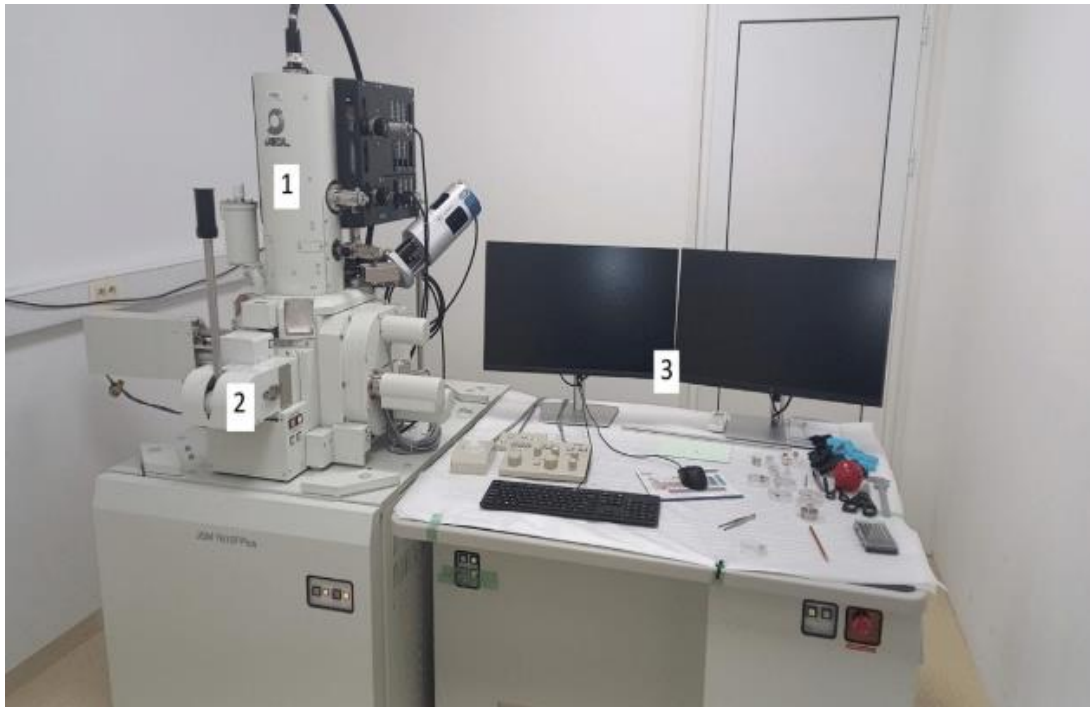
Slika 16. SEM, JEOL JSM-7610FPlus [19]

Glavne komponente SEM-a (engl. Scanning Electron Microscope) odnosno skenirajućeg elektronskog mikroskopa (Slika 16) su elektronska kolona (označena kao 1), komora za uzorke (označena kao 2) i elektronički kontrolni sustav (označen kao 3) [19].