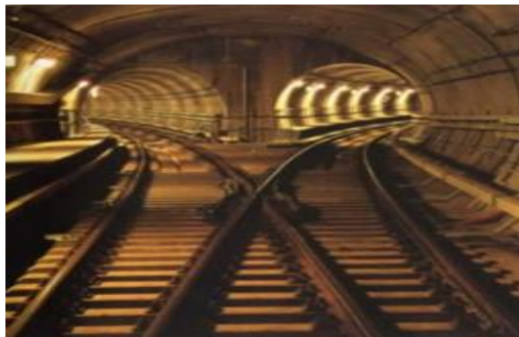
Slika 8. Korozija lutajuće struje u tunelu [9]