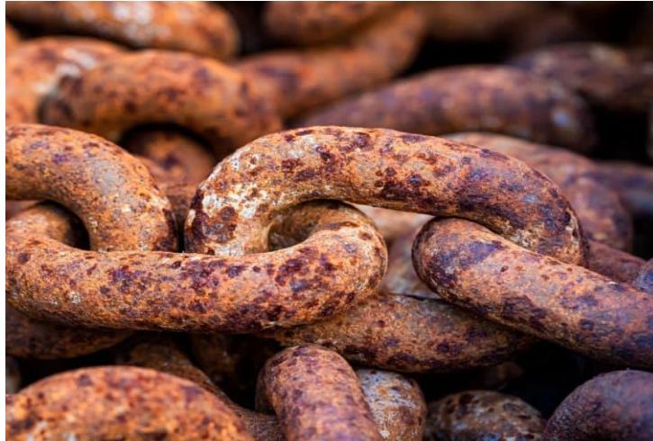
Slika 1. Atmosferska korozija [2]