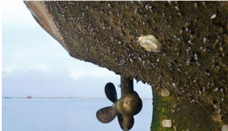
Slika 10. Primjer biokorozije – obraštaj podvodnog dijela brodskog trupa [11]