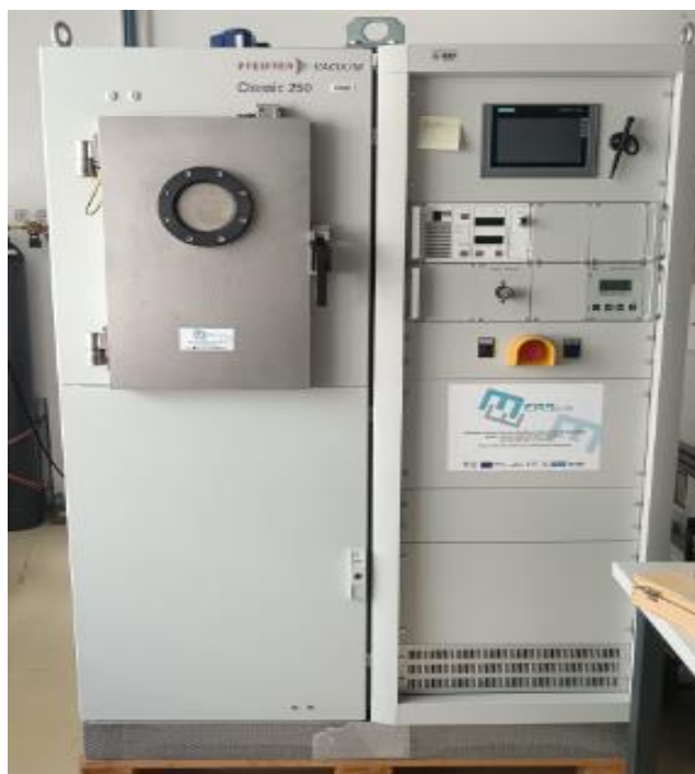
Slika 11. Uređaj za magnetronsko raspršenje [13]

Uređaj za magnetronsko raspršenje modela Classic 250, proizvođača Pfeiffer Vacuum (Slika 11), je sustav koji se koristi za tankoslojno taloženje materijala pomoću magnetronskog raspršenja.