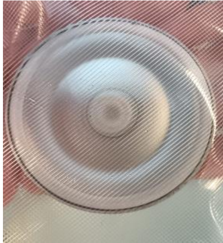
Slika 13. Srebro kao meta za raspršenje [15]