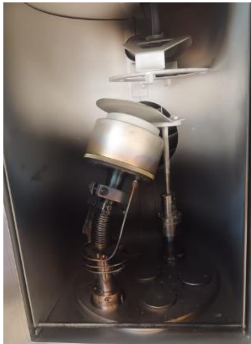
Slika 12. Komora za raspršenje [14]