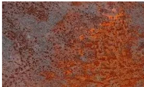
Slika 3. Korozija u suhim plinovima [4]

Korozija u suhim plinovima odvija se kroz kemijsku reakciju između metala i plina, pri čemu nastaju oksidi (Slika 3), sulfidi, halogenidi ili drugi korozijski produkti na površini metala. Ova vrsta korozije povezana je s visokim temperaturama, gdje plinovi uzrokuju kemijske reakcije s metalima.