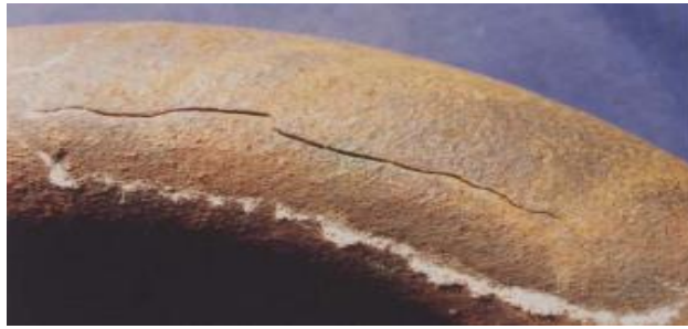
Slika 9. Primjer napetosne korozije ugljičnog čelika – interkristalni karakter loma [10]