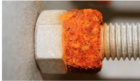
Slika 6. Galvanska korozija [7]

Razlika u elektrodnim potencijalima između dva metala uzrokuje da jedan metal postane anoda koji korodira, dok drugi postaje katoda odnosno zaštićen.