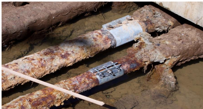
Slika 2. Korozija u tlu [3]

Korozija u tlu ili zemljana korozija (Slika 2.), je proces razgradnje metala koji su zakopani ili su u kontaktu s tlom, odnosno elektrokemijski proces koji se odvija kada metal u kontaktu s tlom djeluje kao elektroda, a tlo kao elektrolit. Proces uključuje oksidaciju metala i redukciju kisika ili drugih oksidansa u tlu. Nakon oksidacije metala, dolazi do gubitka materijala, što slabi metalnu strukturu.