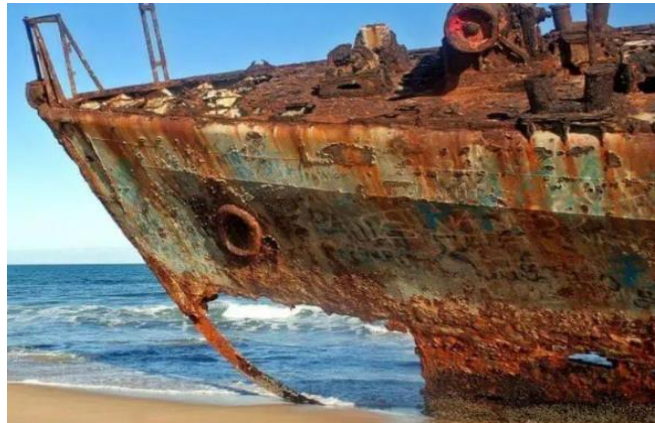
Slika 5. Korozija u okolišu morske vode [6]

Korozija u elektrolitima odnosi se na proces degradacije metala kada su izloženi tekućinama koje provode električnu struju, odnosno otopinama koje sadrže elektrolite. Javlja se u različitim okolišima, uključujući prirodne vode, morske vode (Slika 5), kisele i lužnate otopine, te u industrijskim procesima.