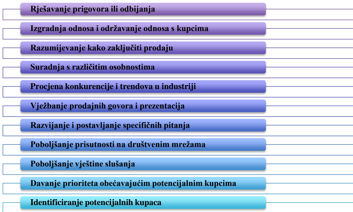
Slika 3 - Prikaz najčešćih tema edukacije prodajnog osoblja

Prilikom edukacije prodajnog osoblja, poduzeća provode razne programe kako bi poslovanje, ali i osposobljenost stručnog kadra bila na nivou, pa tako posebno provode razne edukacije prodajnog osoblja gdje se posebno ističe rješavanje prigovora, izgradnja odnosa s kupcima, zaključivanje prodaje, procjena konkurencije, poboljšanje vještina slušanja, identificiranje kupaca i sl. 16