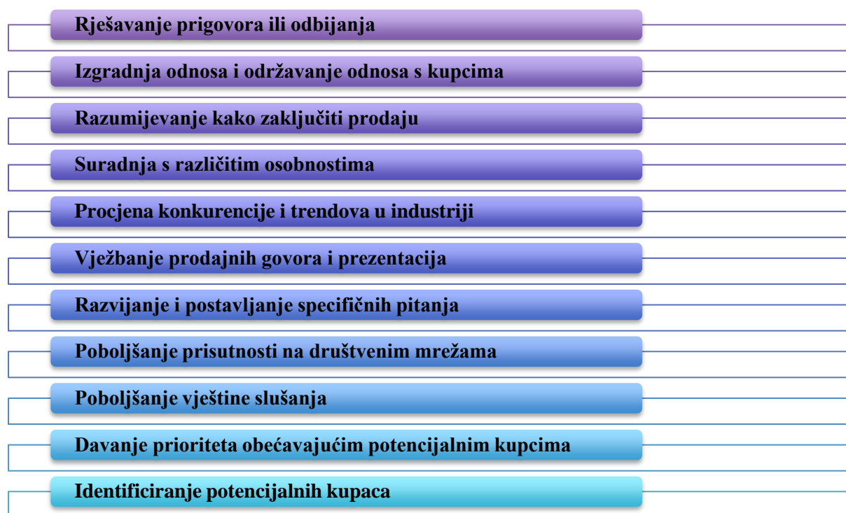
Slika 3 - Prikaz najčešćih tema edukacije prodajnog osoblja

Prilikom edukacije prodajnog osoblja, poduzeća provode razne programe kako bi poslovanje, ali i osposobljenost stručnog kadra bila na nivou, pa tako posebno provode razne edukacije prodajnog osoblja gdje se posebno ističe rješavanje prigovora, izgradnja odnosa s kupcima, zaključivanje prodaje, procjena konkurencije, poboljšanje vještina slušanja, identificiranje kupaca i sl. 16