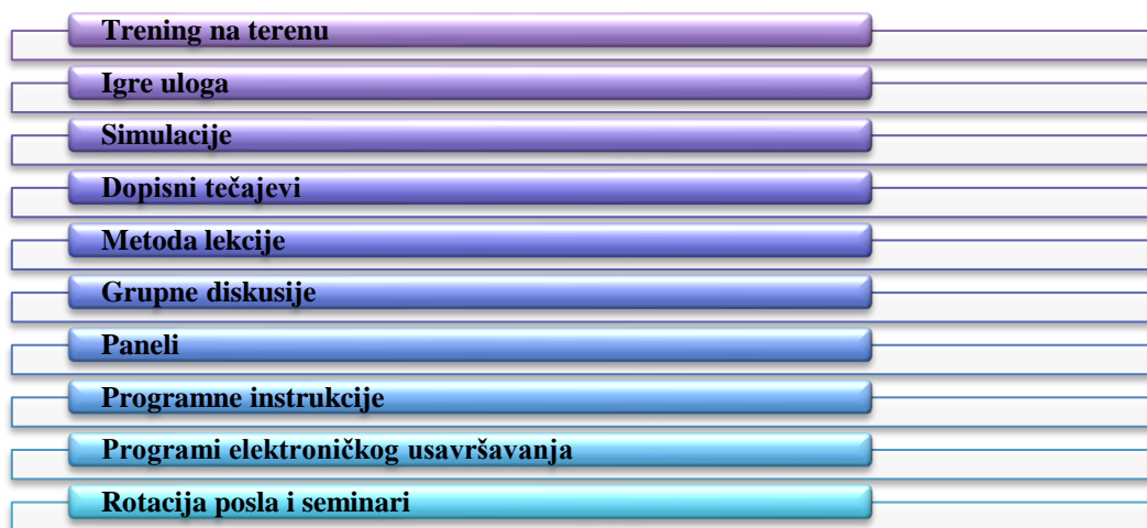
Slika 4 - Prikaz metoda obuke prodajnog osoblja

Kako bi prodajno osoblje bilo što osposobljenije za rad, a samim time i poslovni rezultati što bolji, poduzeća se odlučuju za različite metode obuke prodajnog osoblja, a posebno se ističu trening, igre uloga, simulacije, grupne diskusije, paneli, rotacija posla, te razni programi električnog usavršavanja. 21