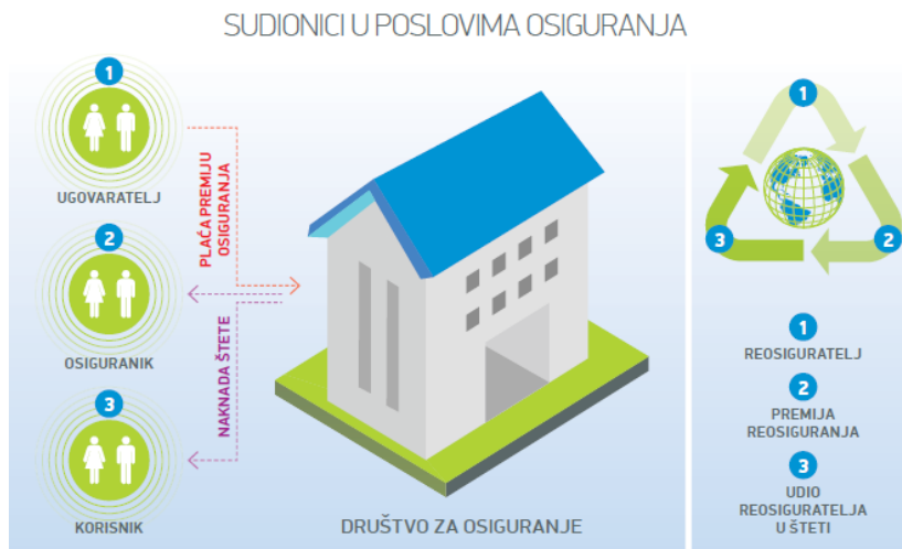
Slika 1 Sudionici u poslovima osiguranja