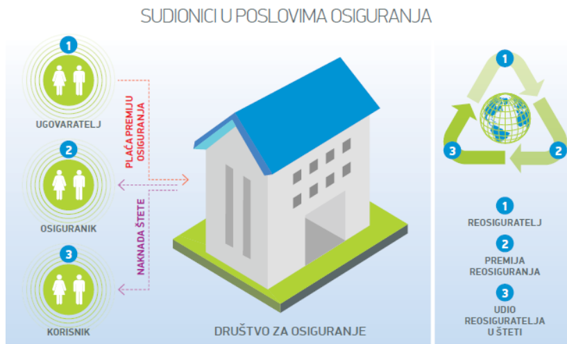
Slika 1 Sudionici u poslovima osiguranja