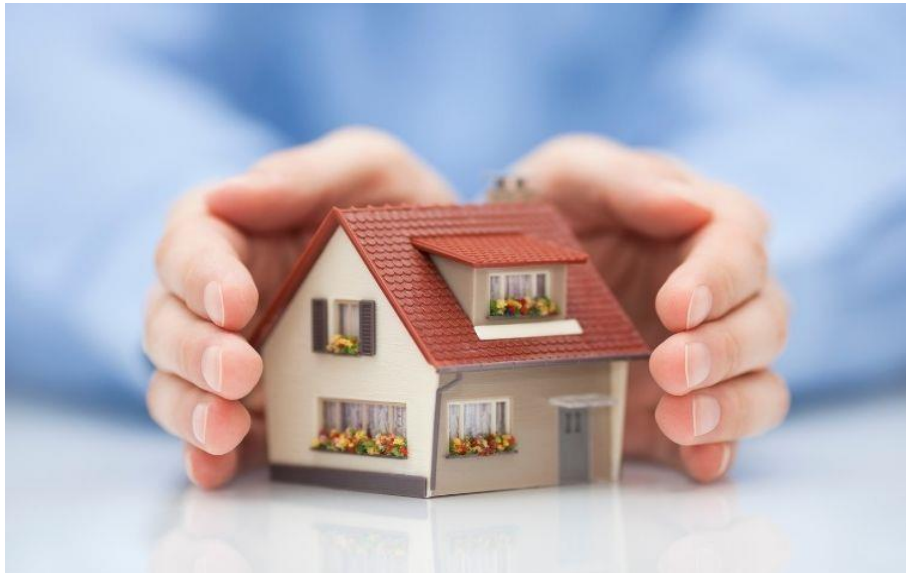
Slika 5 Osiguranje kuće

Izvor: Kompare, dostupno na: https://kompare.hr/savjetnik/osiguranje-imovine/ (22.12.2023.)