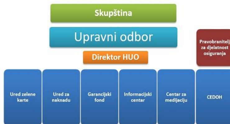
Slika 3 Tijela upravljanja