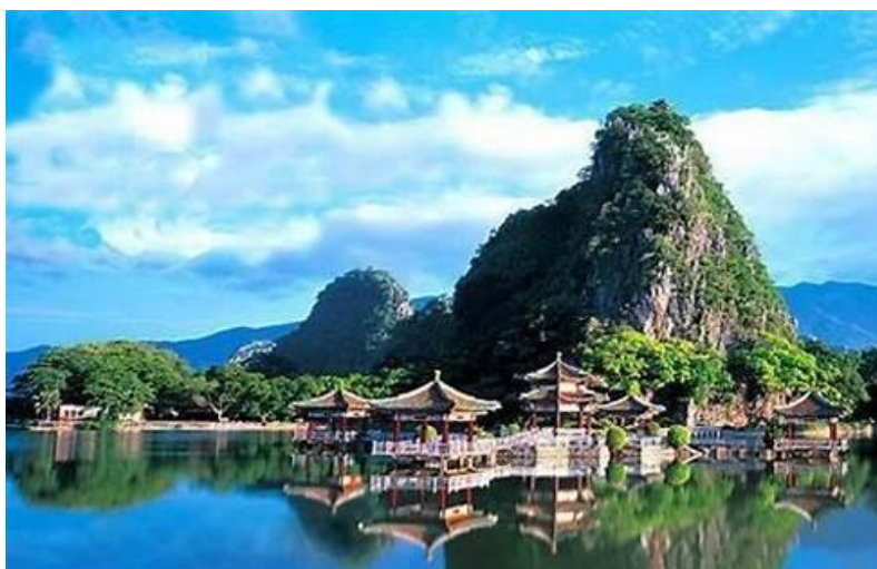
Slika 11. Zaljev grada Zhaoqinga