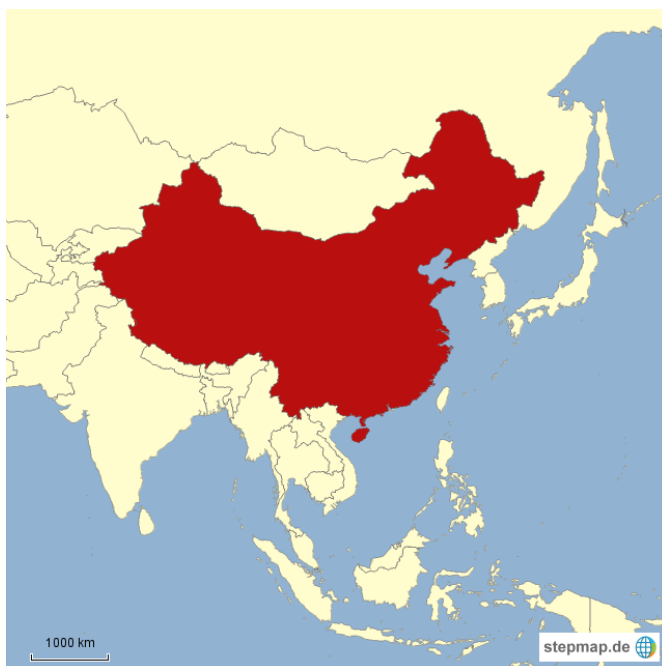
Slika 1. Geografski smještaj Kine