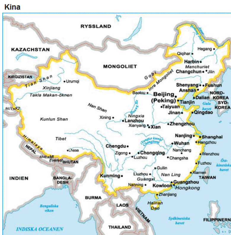
Slika 2. Karta Kine