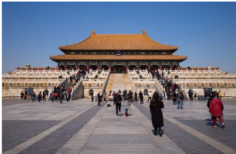
Slika 12. Zabranjeni grad u Peking