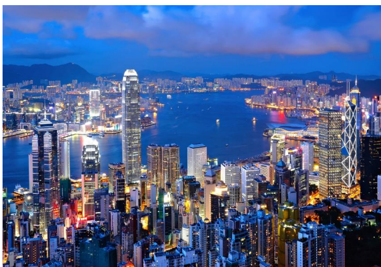
Slika 15. Hong Kong