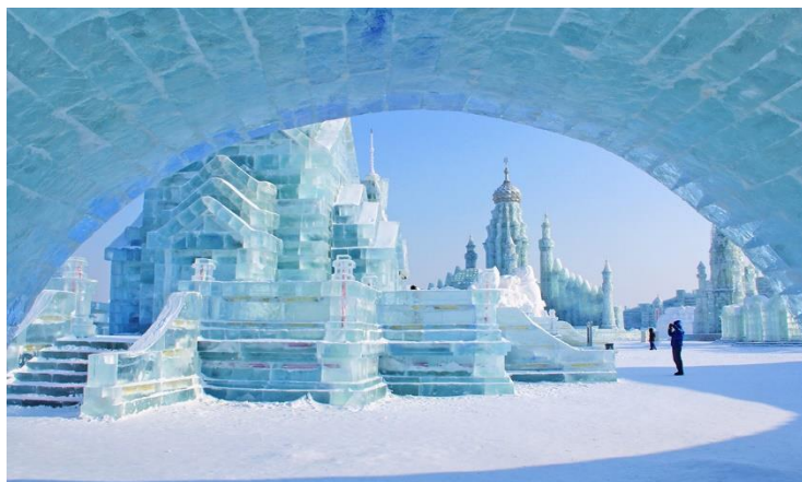
Slika 6. Grad Harbin