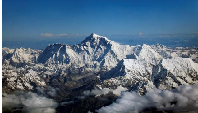
Slika 7. Mount Everest