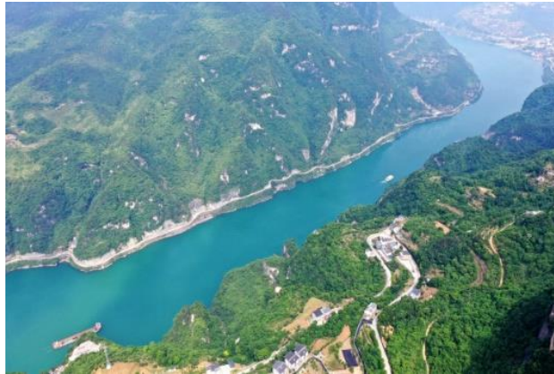
Slika 9. Rijeka Yangtze