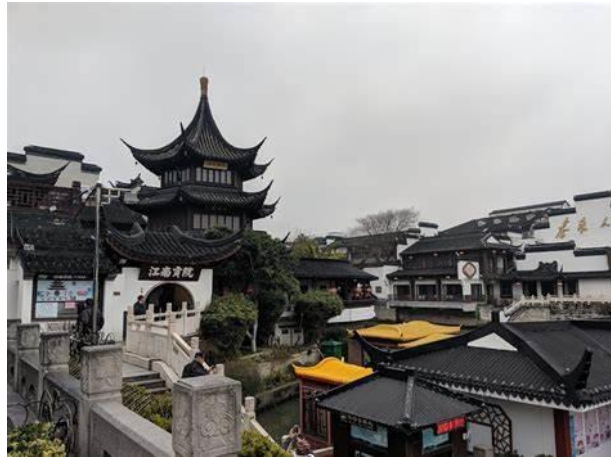
Slika 4. Grad Nanjing