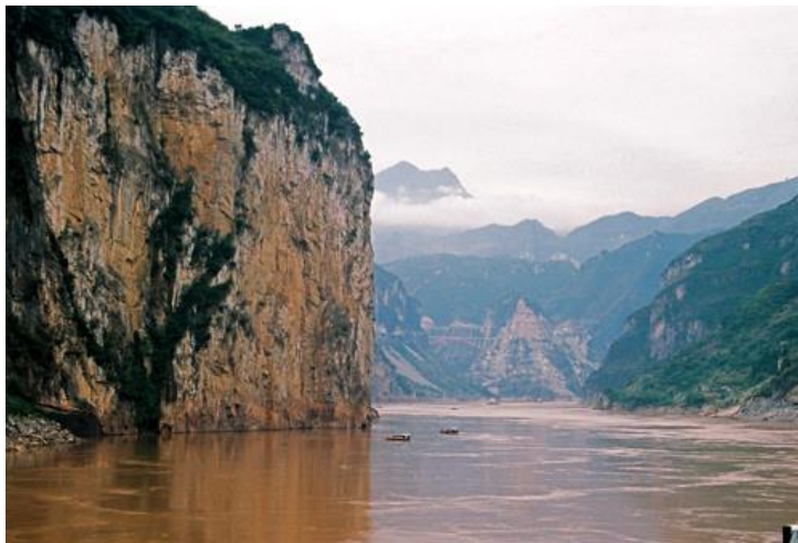
Slika 8. Žuta rijeka