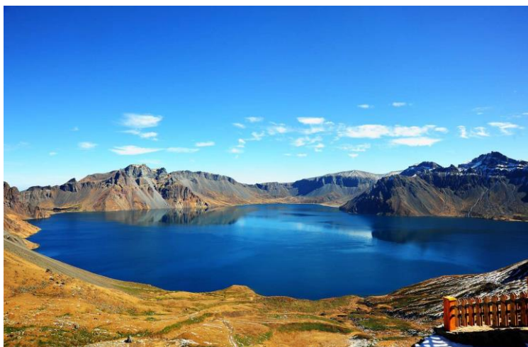
Slika 10. Tianchi jezero