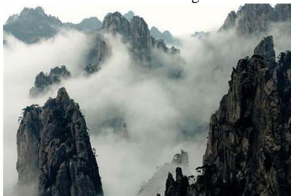
Slika 5. Planina Huang