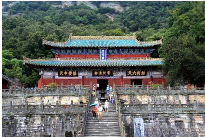
Slika 14. Hram Wudang