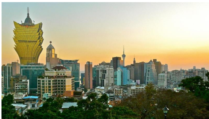
Slika 3. Grad Macao