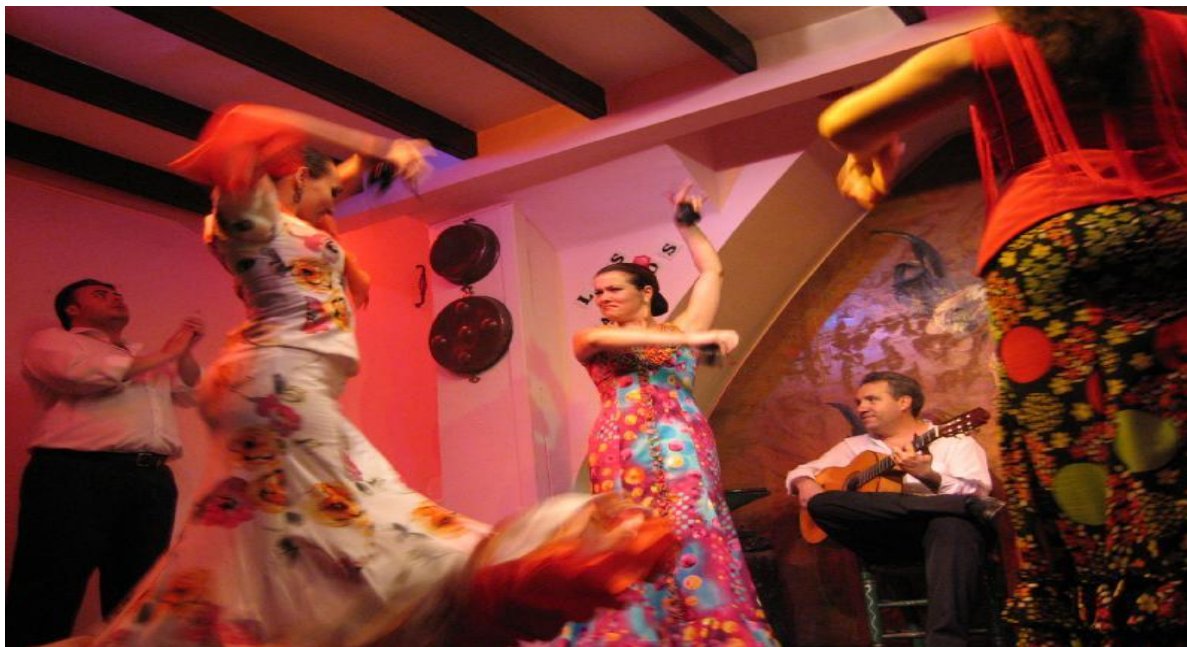
Slika 8. Flamenco - godišnji festival plesa