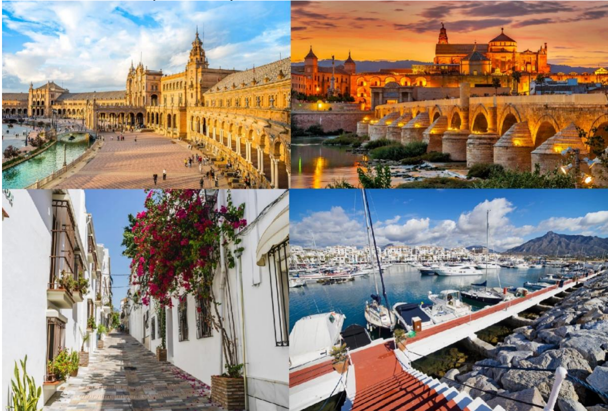
Slika 7. Plaza de España, Mezquita de Córdoba, Marbella Old Town i Puerto Banús