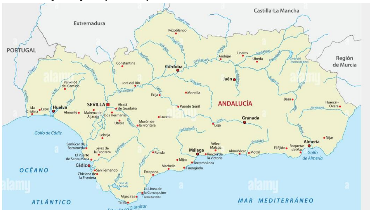
Slika 1. Geografski položaj Andaluzije