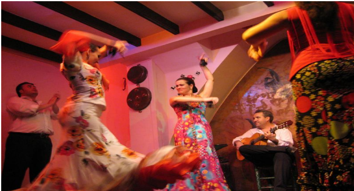
Slika 8. Flamenco - godišnji festival plesa