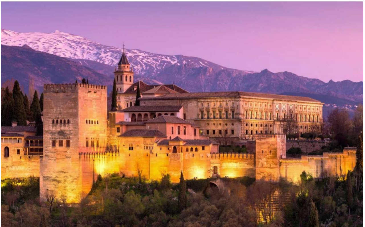
Slika 3. Palača Alhambra – simbol arhitekture Andaluzije