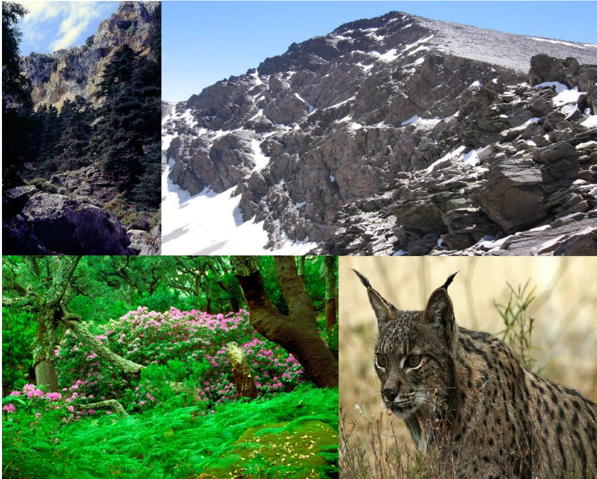
Slika 2. Reljef, flora i fauna Andaluzije