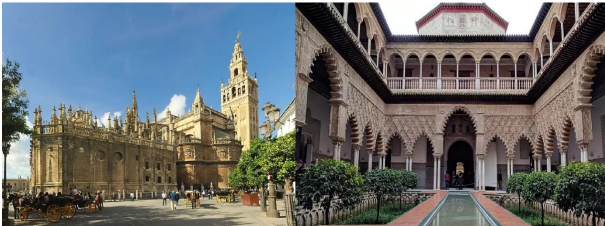
Slika 4. Katedrala i Alcazar u Seville