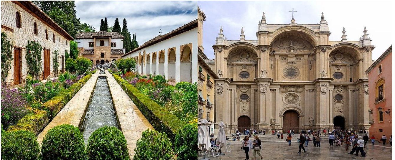
Slika 5. Generalife i katedrala u Granadi