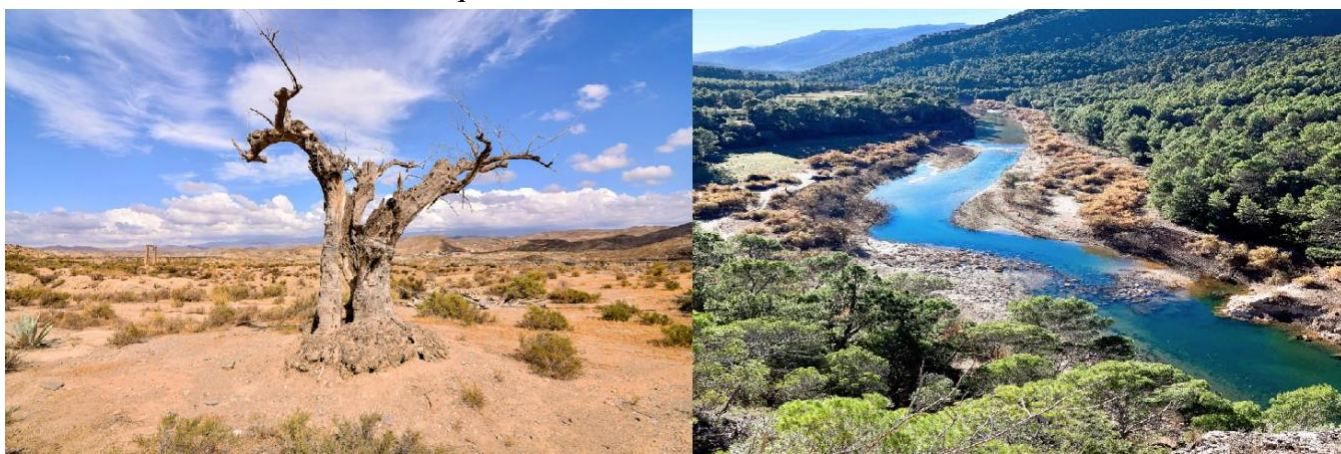
Slika 6. Desierto de Tabernas i Parque Natural Sierras de Cazorla