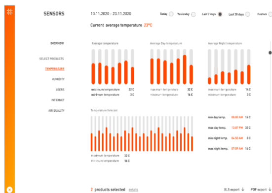
Slika 1. Dizajn sučelja od senzora s klupe

Hrvatska start-up firma sa sjedištem u Solinu proizvodi rješenja za pametne gradove koja se baziraju na obnovljivim izvorima energije radi smanjivanja zagađenja zraka i okoline. Proizvod po kojem su poznati je pametna klupa ( smart bench ) koja radi na solarni izvor napajanja. Klupa omogućuje korisniku pristup internetu, punjenje raznih uređaja, praćenje kvalitete zraka te fizikalnih parametara vremena kao što su vlaga, temperatura i tlak. Takvi podaci mogu poslužiti za monitoring kvalitete zraka na zadanoj lokaciji te eventualno alarmirati zadužene službe o mogućim većim onečišćenjima. Također inovativan je proizvod po tome što je dizajniran s LCD ekranom koji može poslužiti kao oglasna ploča i davati informacije turistima koje su potrebne da bi lakše se snalazili na lokaciji gdje je pametna klupa ugrađena.