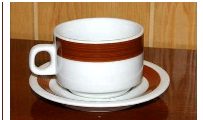
Slika 7. Najprodavaniji model koji je bio svugdje zastupljen