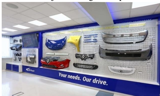
Slika 8. Primjer raznih gotovih proizvoda