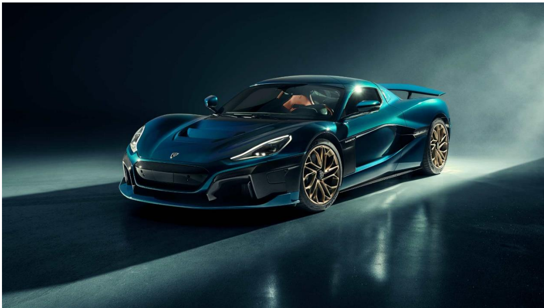
Slika 6: Eksterijer Rimac Nevera