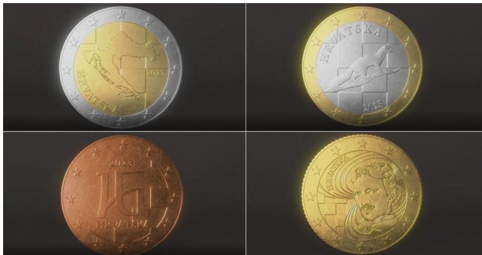
Slika 4. Primjer dizajna euro hrvatske kovanice