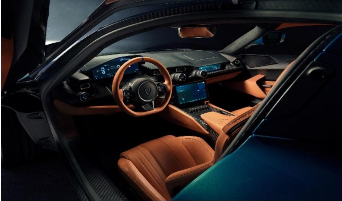
Slika 5 :Interijer automobila firme RIMAC