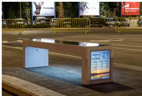
Slika 12. Pametna klupa