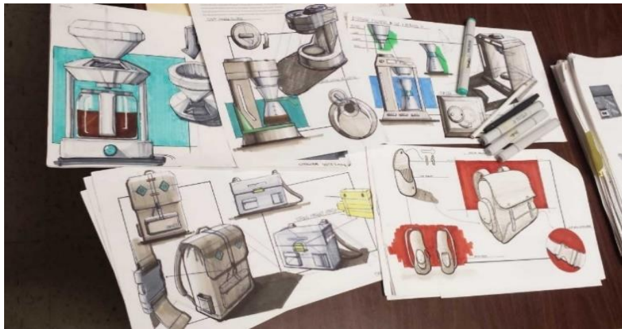
Slika 1. Dizajn ruksaka