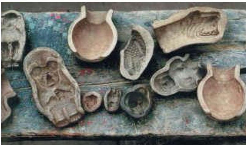
Slika 2. Antički kalup