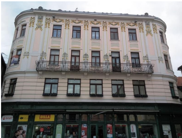
Slika 2: Primjer građevine stila secesije u Splitu

L'art nouveau ili secesija je stilski pravac koji se javio u 19. st. kao reakcija na industrijalizaciju. Bio je izrazito ornamentalan, koristio je floralne elemente zbog čega se u Italiji nazivao Floreal . Zbog svoje zaigrane naravi i uvođenja novosti u Njemačkoj se nazivao Jugendstil , a javio se kao reakcija na akademizam i eklekticizam. Prva secesija dogodila se u Francuskoj, kad je 1890. ustanovljen "Salon au Champs-de-Mars", na čijem su čelu bili slikari Ernest de Meissonnier i Pierre Puvis de Chavannes . 6