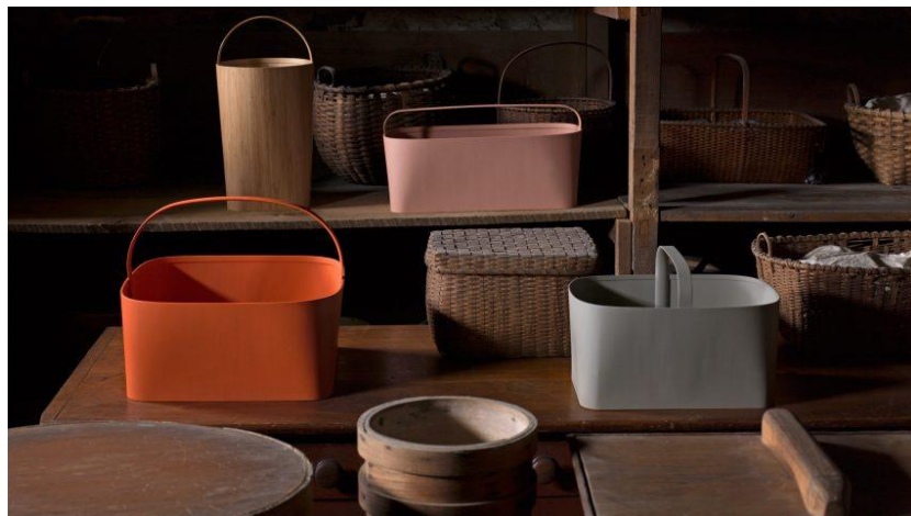
Slika 3. Shakers design