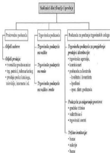
Slika 2 Prikaz sudionika u procesu distribucije i prodaje