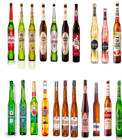
Slika 6 Asortiman Heineken Hrvatska