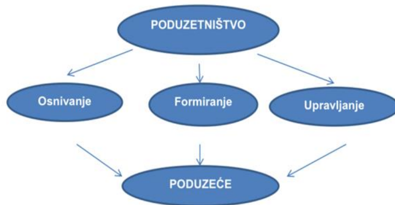
Slika 1 Prikaz poduzetničke aktivnosti

Izvor : Bobera, D., Hunjet, A., Kozina , G. Poduzetništvo. Varaždin: Sveučilište Sjever , 2015 str.20