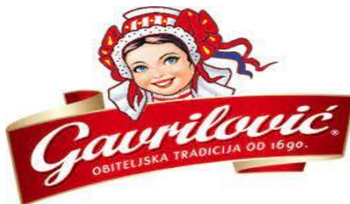
Slika 5 Logo Gavrilović