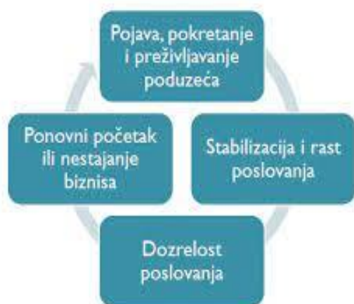
Slika 6 Životni ciklus poduzeća