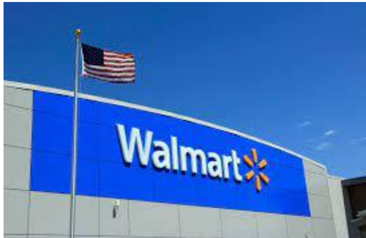
Slika 3 Walmart