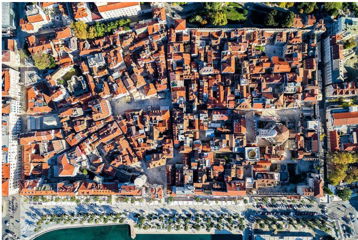
Slika 2. Dioklecijanova palača