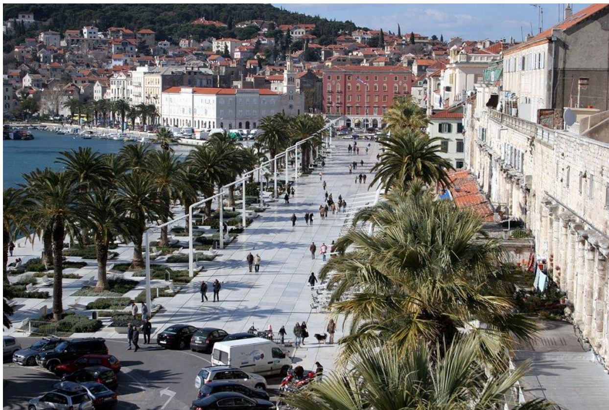
Slika 3. Splitska Riva