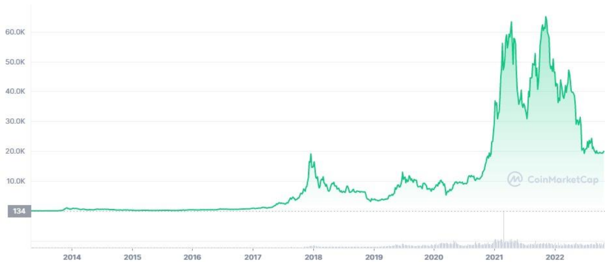
Slika 4.6 Grafički prikaz cijene bitcoina izražene u dolarima (2013-2022)

Izvor: CoinMarketCap, Bitcoin, https://coinmarketcap.com/currencies/bitcoin/ [28.10.2022.]