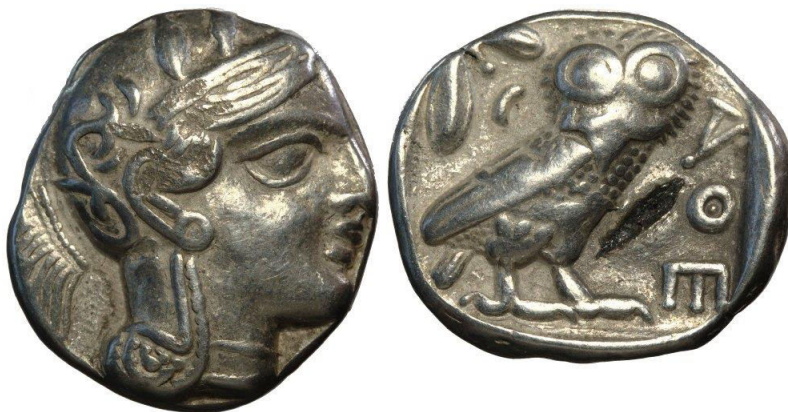
Slika 3. Prvi kovani novac 640. pr. Krista

Metali, a posebno zlato, bili su vrlo pogodan novčani materijal. Zlato je bilo relativno rijetko, lako se čuva i prenosi, u njegovu proizvodnju treba uložiti mnogo rada pa je relativno skup. Od tada metali, a posebno zlato ima bitnu ulogu kao novčani materijali. U početku su te plemenite kovine bile izljevane u kolute ili šipke i kod razmjene su vagane a tek su se kasnije počele lijevati kovanice, kakve ih danas poznajemo. Bila je puno važnija težina, nego li oblik. Novac se, dakle, u početku vagao. 22