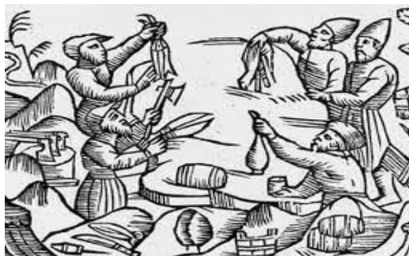
Slika 2. Prikaz trampe