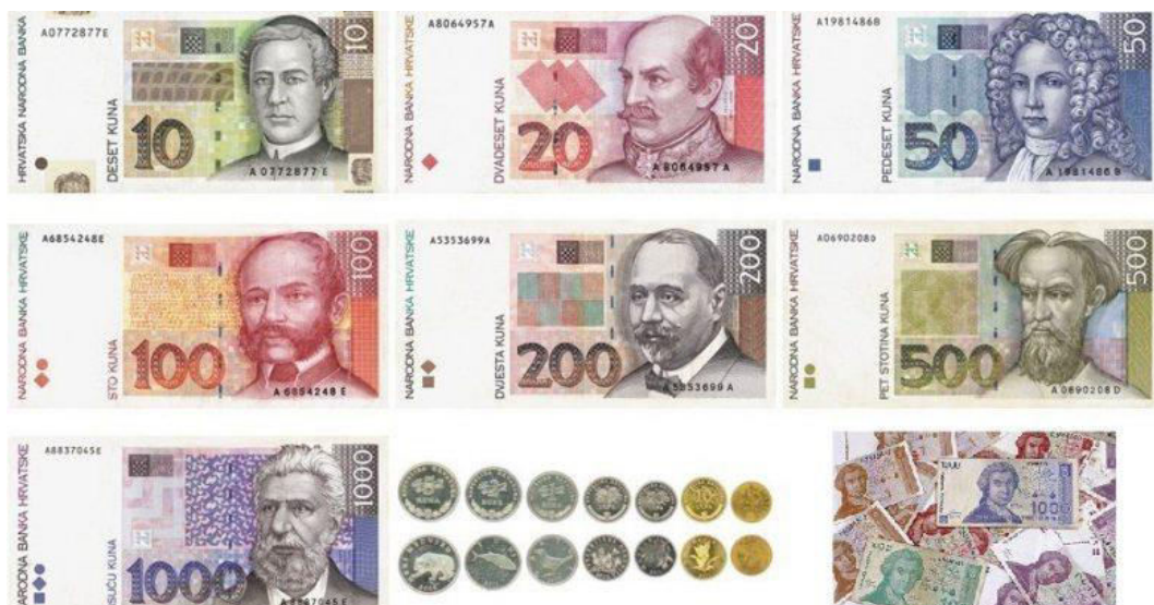
Slika 7. Kovanice i novčanice Hrvatske kune