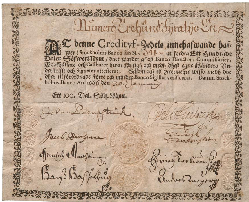
Slika 4. Prvi papirni novac izdala je Švedska 1661. godine