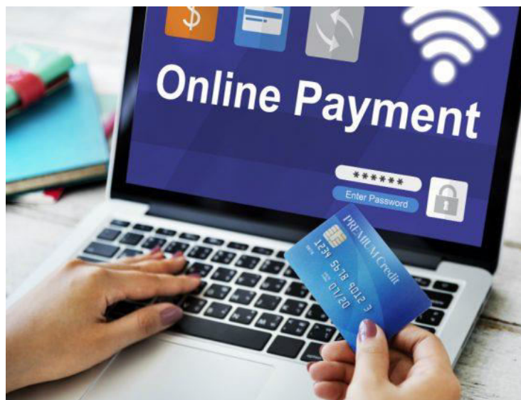
Slika 9. Elektronsko plaćanje