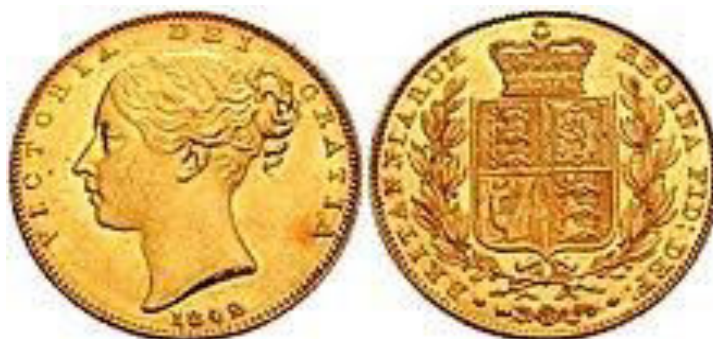
Slika 5. Britanski zlatnik