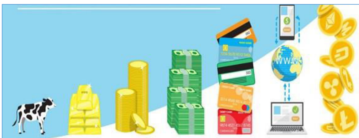
Slika 1. Povijest novca