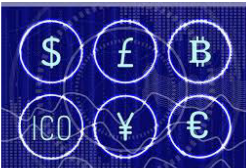
Slika 8. Virtualni novac