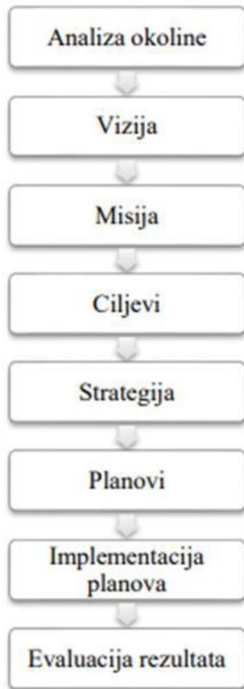
Slika 2. Proces planiranja

Izvor: Sikavica, P. i dr., Temelji menadžmenta , Zagreb: Školska knjiga, 2008., str. 144.