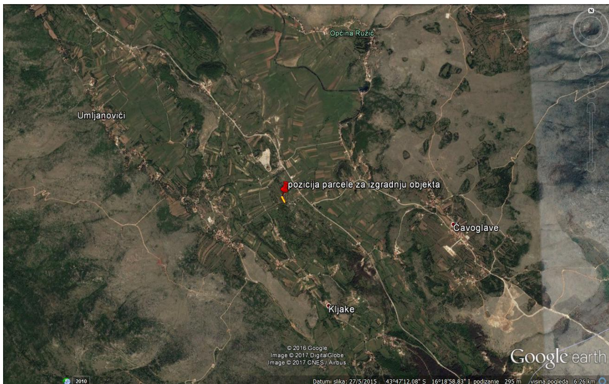
Slika 3. Lokacija budućeg turističkog objekta