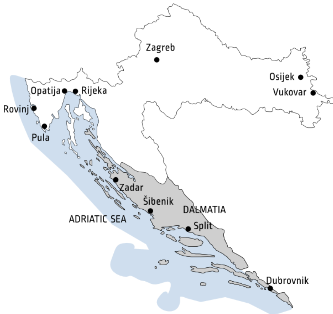
Slika 2. Teritorij Dalmacije