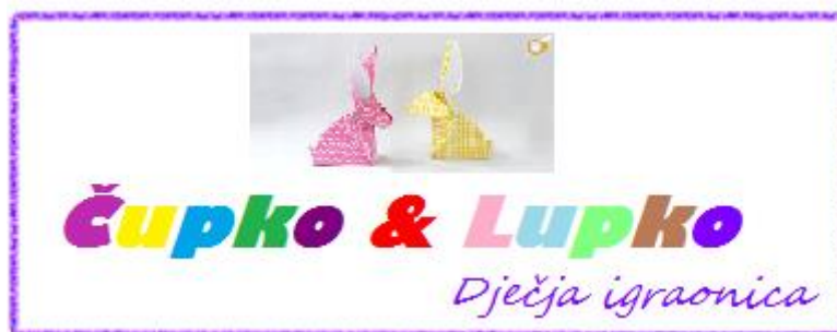
Slika 3. Logo tvrtke

Marketinški plan je program koji obuhvaća informacije koje su dobivene istraživanjem tržišta. Marketinške aktivnosti koje se planiraju provoditi kod ovakve vrste projekta je upravo konstantno praćenje i istraživanje tržišta ali i kontrola i nadziranje istog. Isto tako, uobličena je specifična marketinška strategija koja će se u primjeni temeljiti na suvremenim poslovno-marketinškim postulatima. Cilj koji bi trebao biti za svaku tvrtku je isti – maksimizirati zadovoljstvo svojih kupaca.