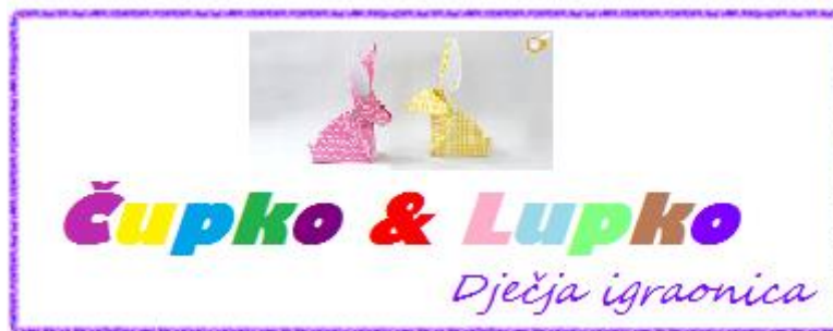
Slika 3. Logo tvrtke

Marketinški plan je program koji obuhvaća informacije koje su dobivene istraživanjem tržišta. Marketinške aktivnosti koje se planiraju provoditi kod ovakve vrste projekta je upravo konstantno praćenje i istraživanje tržišta ali i kontrola i nadziranje istog. Isto tako, uobličena je specifična marketinška strategija koja će se u primjeni temeljiti na suvremenim poslovno-marketinškim postulatima. Cilj koji bi trebao biti za svaku tvrtku je isti – maksimizirati zadovoljstvo svojih kupaca.