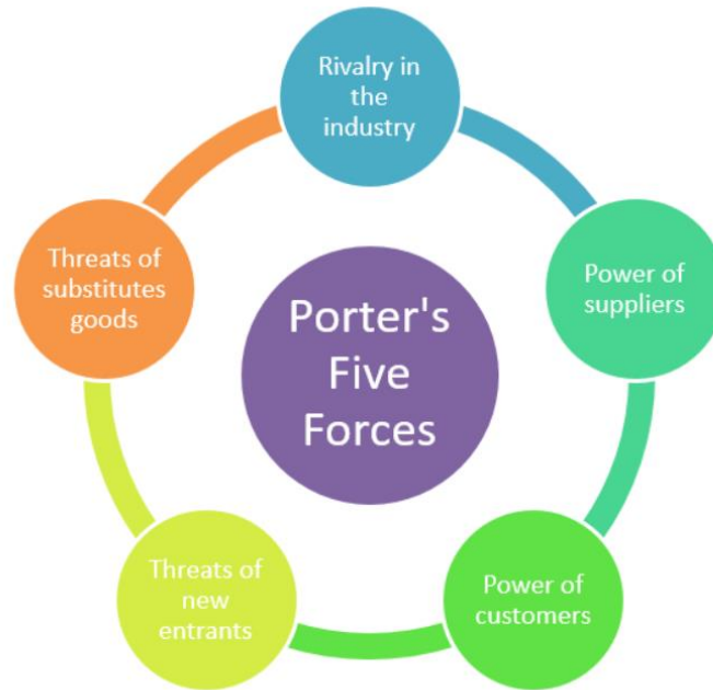
Slika 2. Porterov model pet konkurentskih snaga