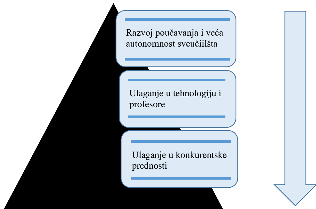
Slika 2. Piramida razvoja edukativnog turizma s naglaskom na razvojne i ulagačke potencijale