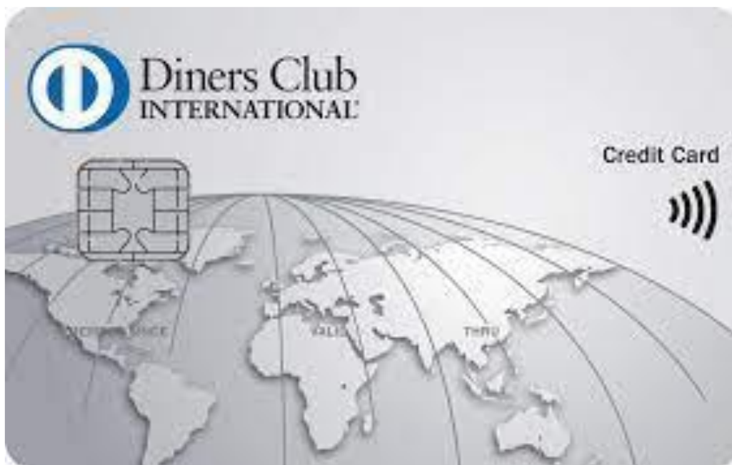
Slika 10. Prikaz Diners kartice