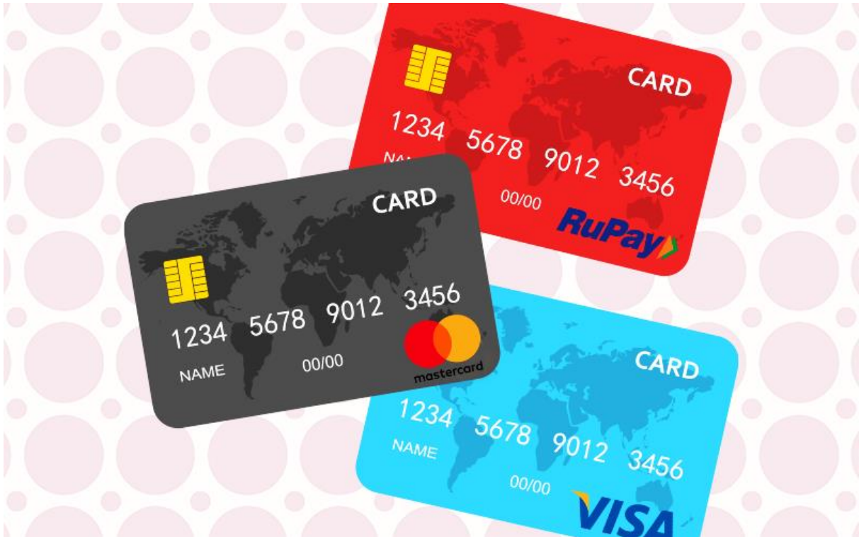
Slika 7. ATM card