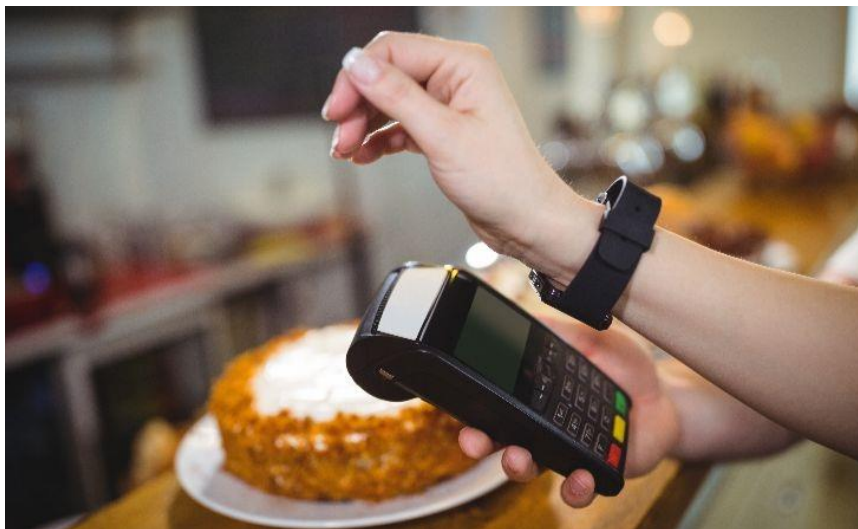
Slika 16. Plaćanje putem sata