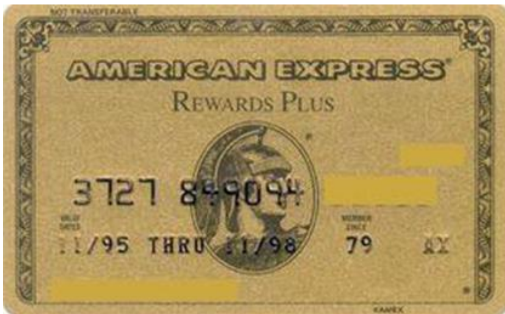
Slika 9. Prikaz American Express Gold kartice