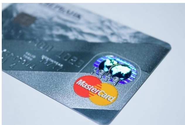
Slika 11. Mastercard