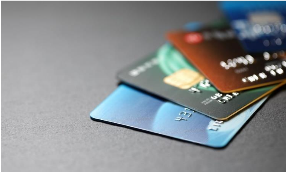
Slika 5. Platne kartice