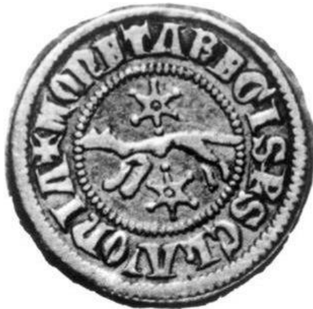
Slika 2. Srebrni banovac