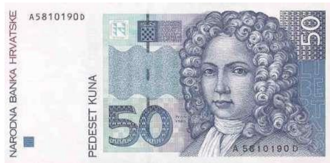
Slika 3. Novčanica od 50 kuna