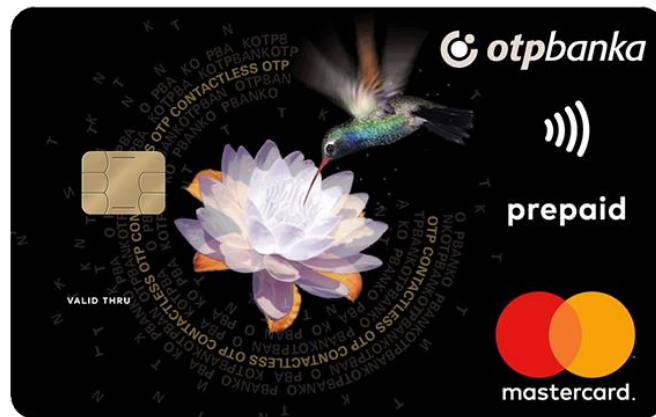
Slika 8. Prepaid card

Izvor: https://www.otpbanka.hr/gradani/mastercard-prepaid-kartica [25.08.2022.]