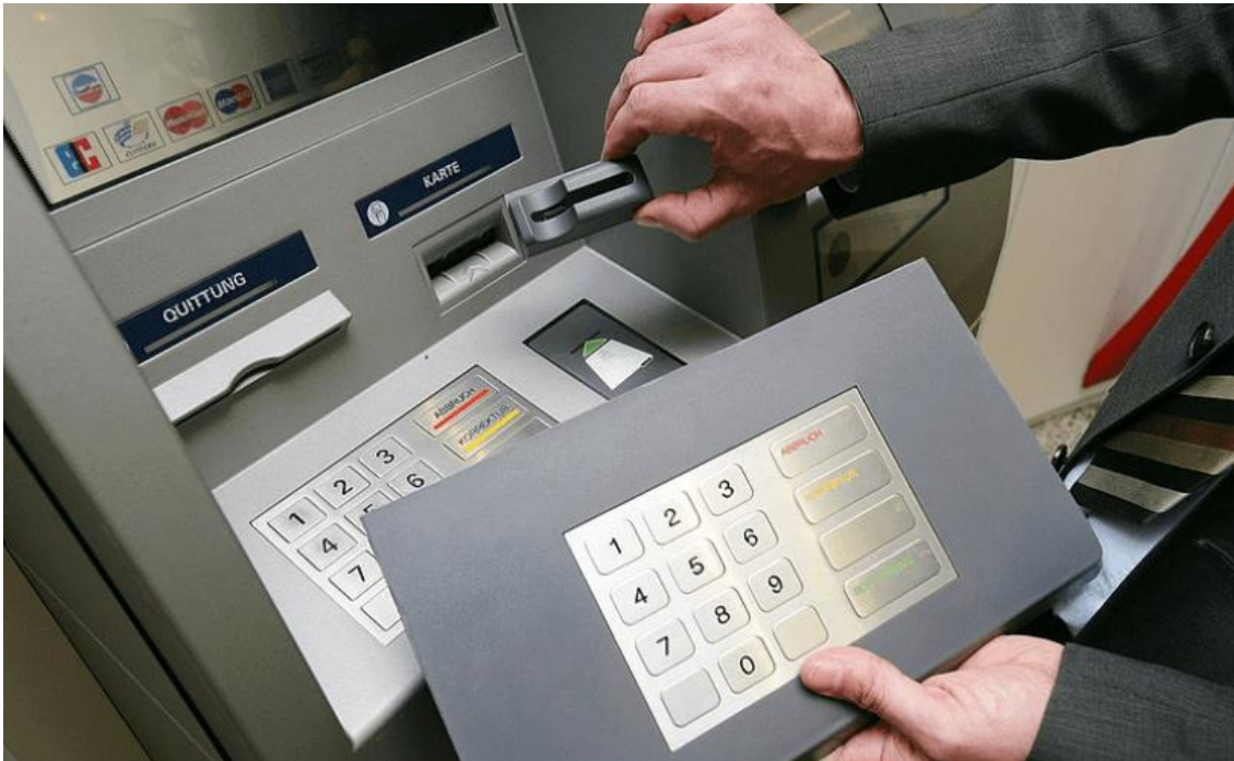
Slika 14. Lažna tipkovnica na bankomatima