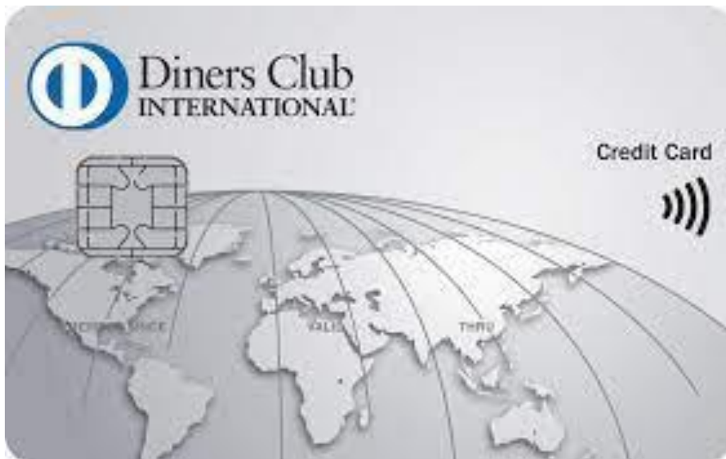
Slika 10. Prikaz Diners kartice