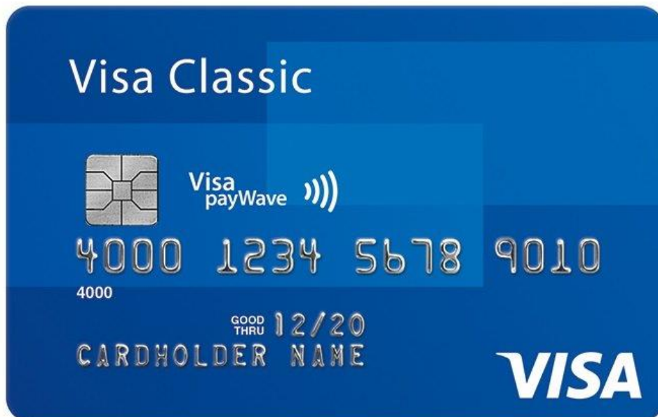
Slika 12. Visa card