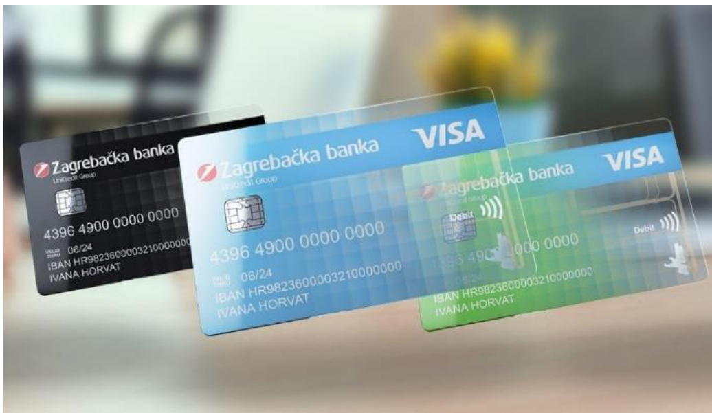
Slika 6. Debit card