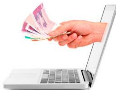
Slika 4. Elektroničko plaćanje