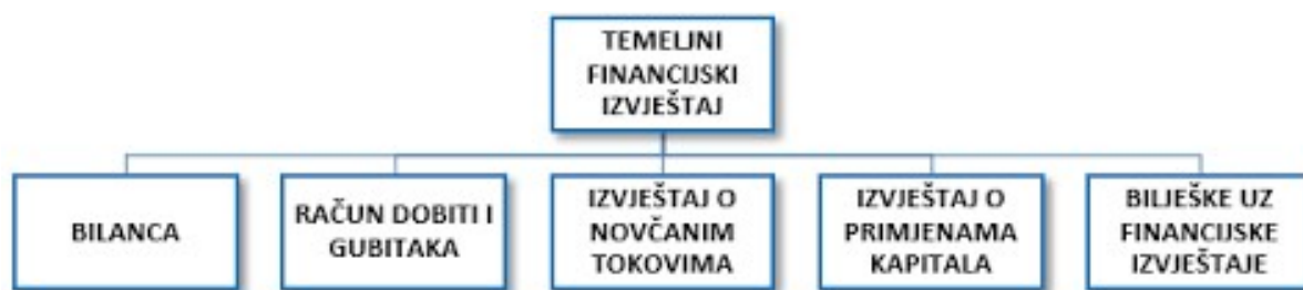
Slika 1 Temeljni financijski izvještaji