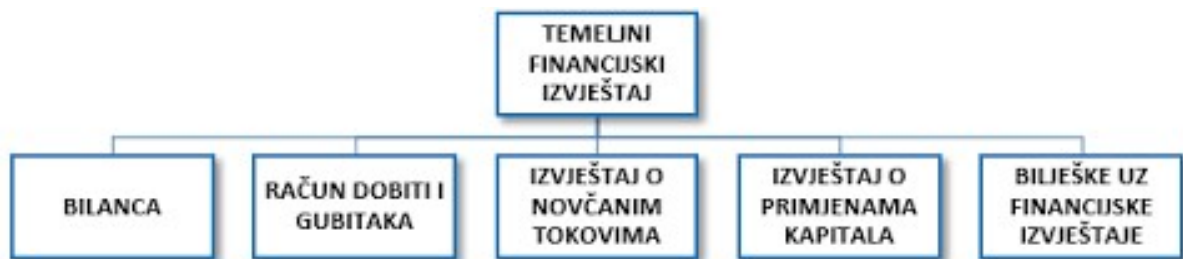
Slika 1 Temeljni financijski izvještaji