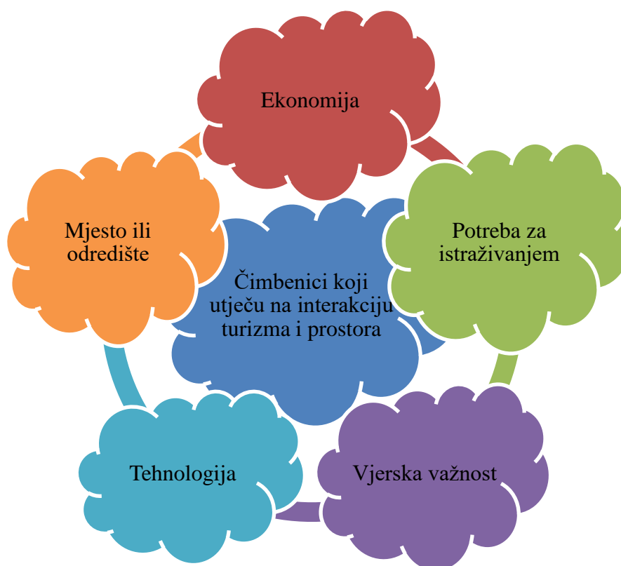
Slika 2. Čimbenici koji utječu na interakciju turizma i prostora

Uređeni prostor dovodi ili odvodi posjetitelje te o ukupnom čovjekovom okolišu ovisi prihvaćenost na turističkom tržištu. Turizam je u svom najboljem obliku kada određite ima povoljnu klimu. Suprotno tome, sve neželjene promjene u okolišu i vremenu kao što su jaki vjetrovi, poplave, suša i ekstremna klima mogu negativno utjecati na turizam.