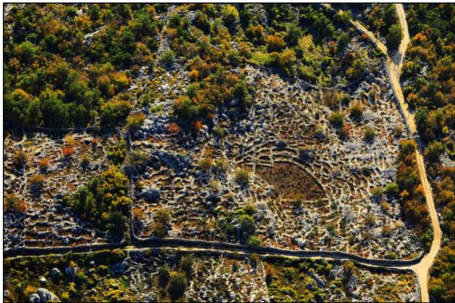
Slika 10. Kostanjsko-podgrajska ljuta, prostor iznimne pejzažne vrijednosti

Prostor Kostanjsko-podgrajske ljuti je prepoznat kao prostor razvojnog potencijala koji, oplemenjen dugoročno održivim turističkim sadržajima kao što je Interpretacijski centar Poljica u kombinaciji sa adrenalinskim parkom ili pustolovno-izletničkim centrom s tematskim stazama, može postati epicentar revitalizacije Poljica. 29