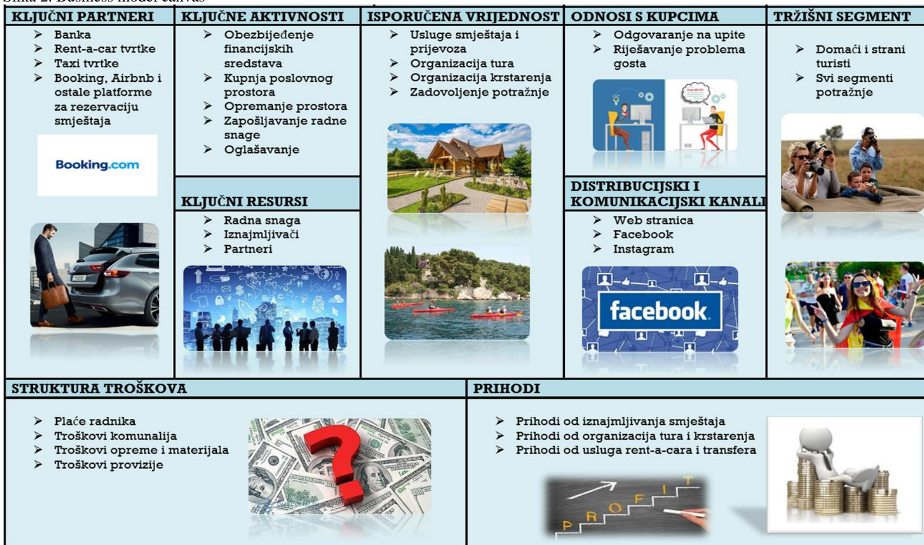
Slika 2. Business model canvas