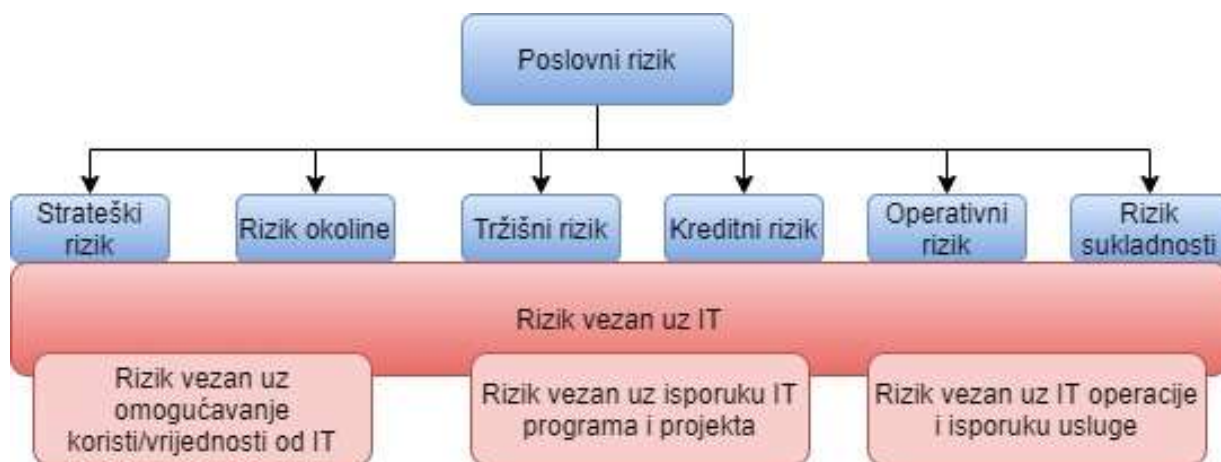
Slika 1. Vrste rizika u poslovnom sustavu [4]

Rizik je vjerojatnost da će nastati događaj koji će imati negativne posljedice na pojedinca, poduzeće ili društvo općenito. Nezaobilazni su dio ljudskih aktivnosti i svakog posla. Uvijek su povezani s neizvjesnošću, što vrijedi za naš svakodnevni život, ali i svaki poslovni sustav. Oni su funkcija imovine, prijetnje, ranjivosti i mogućih posljedica. Imovina je sve što poslovni sustav posjeduje i što za njega ima neku poslovnu vrijednost. To može biti materijalna imovina, financijska imovina, informacije, procesi i slično. Postoji više načina kategorizacije rizika, njihova najčešća podjela u nekom poslovnom sustavu, prikazana je na slici 1.