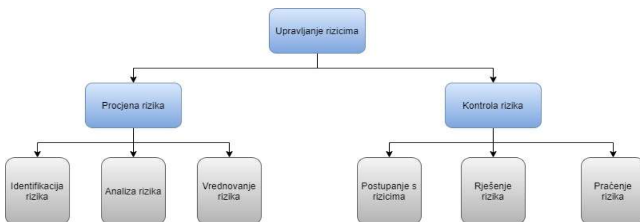
Slika 3. Proces upravljanja rizicima

Upravljanje rizikom uvedeno je kao eksplicitan proces u razvoju softvera 1980. Otac softvera za upravljanje rizikom smatra se Barry Boehm [5]. On je definirao spiralni model temeljen na „Model životnog ciklusa razvoja softvera“ i zatim je opisao prvi proces upravljanja rizicima. Većina procesa definirana od tada proizlaze iz njegovog temeljnog procesa. Njegov proces upravljanja rizicima sastoji se od dva podprocesa: procjena rizika i kontrola rizika, a prikazani su na slici 3.