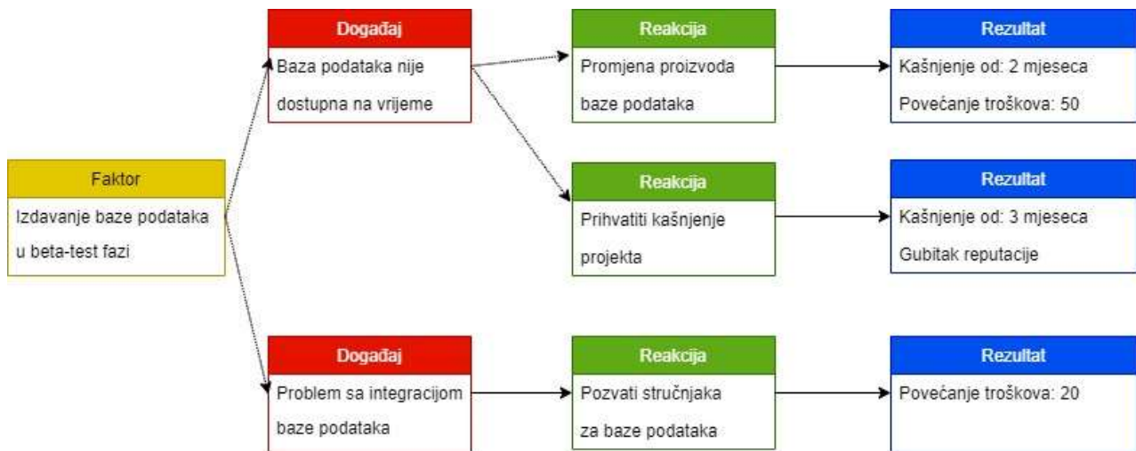
Slika 2. Scenarij rizika

Za razliku od čisto tekstualnih opisa rizika, scenariji rizika nude tu prednost da se rizici mogu podijeliti na pojedinačne elemente, što omogućuje definiranje ciljanih mjera.