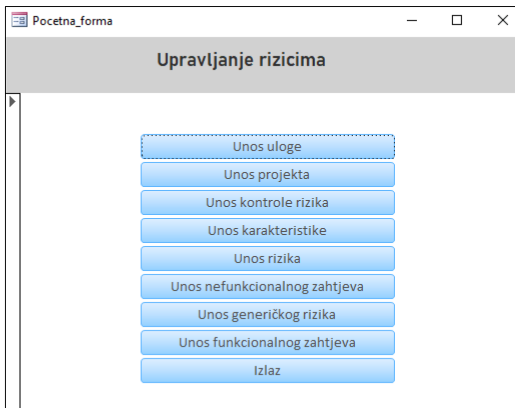
Slika 16. Početna forma Aplikacije za upravljanje rizicima

Početna forma aplikacije na slici 16. sastoji se od izbornika: unos uloge, unos projekta na kojem se može pojaviti rizik, kontrola rizika, karakteristika rizika, rizik, nefunkcionalni i funkcionalni zahtjevi, generički rizici te mogućnost izlaze iz aplikacije.