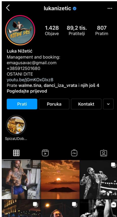
Slika 8: profil Luke Nižetića

Neki od segmenata koje su analizirali bili su: dob, spol i aktivnost pratitelja na društvenim mrežama.