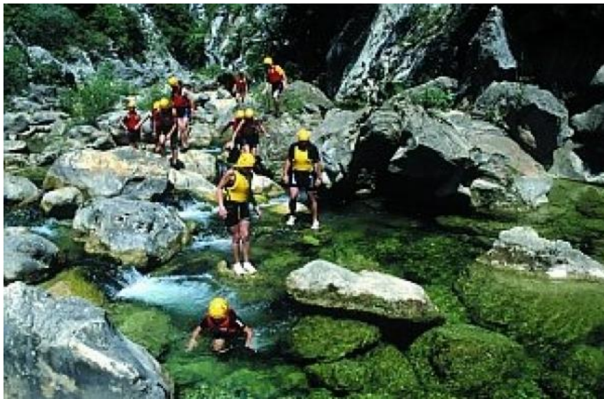
Slika 12. Kanjoning