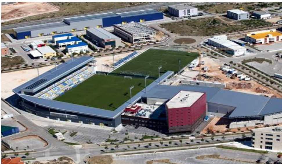
Slika 8. Sportski centar Dugopolje