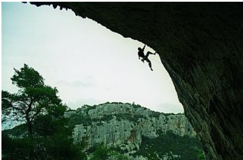
Slika 13. Slobodno penjanje