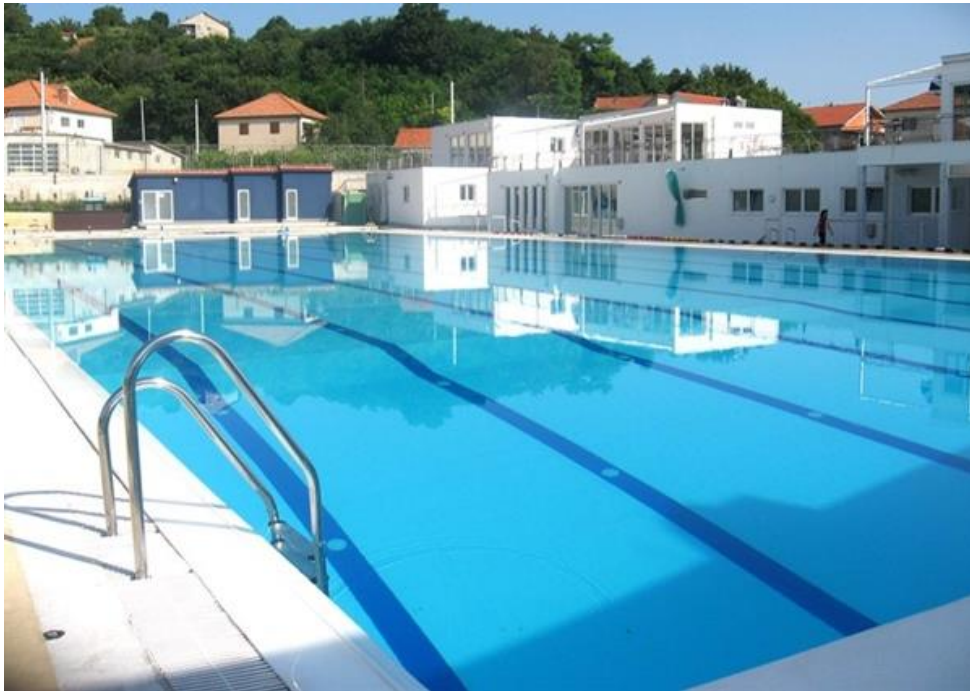
Slika 3. Gradski bazen u Sinju