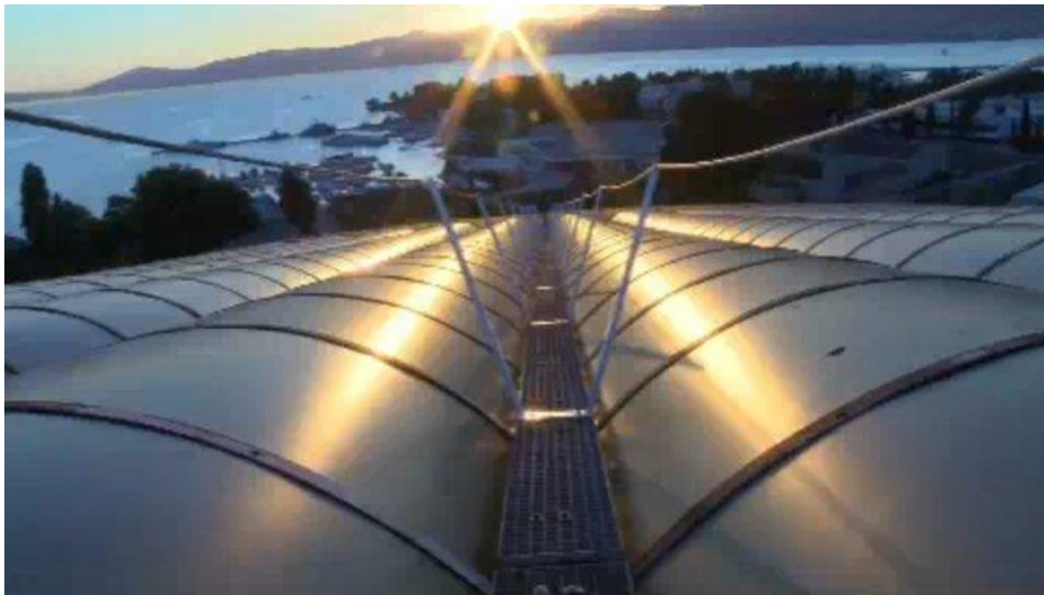
Slika 6. Krov stadiona Poljud