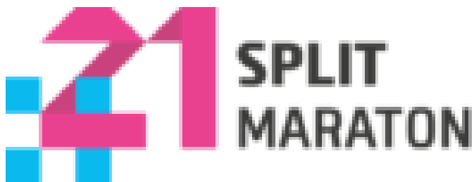
Slika 18. Logo Split half maraton