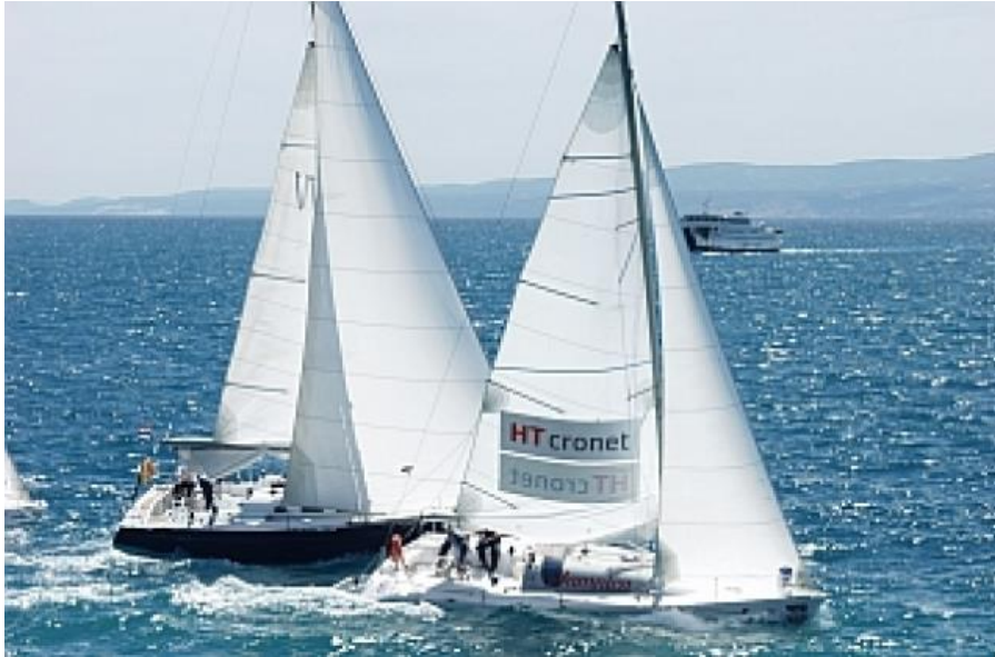
Slika 10. Jedrenje