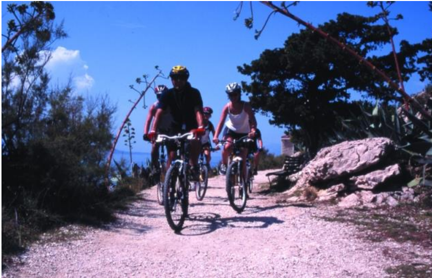
Slika 14. Biciklizam