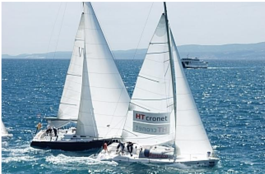
Slika 10. Jedrenje