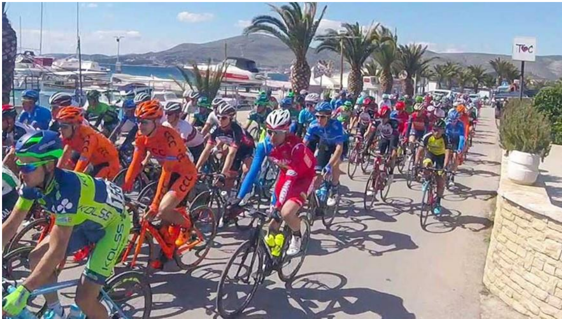
Slika 22. Treća etapa biciklističke utrke