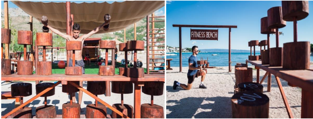
Slika 15. Fitness beach