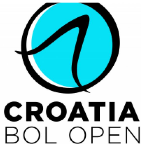
Slika 16. Logo Croatia Bol open