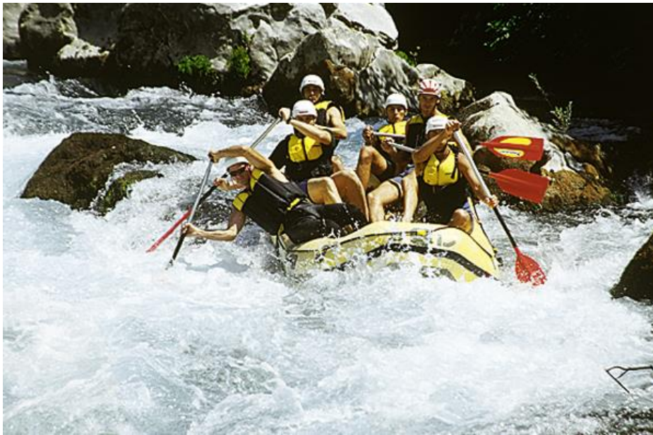
Slika 11. Rafting na Cetini