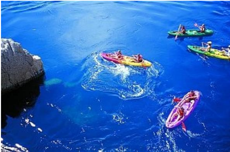
Slika 9. Vožnja kajakom na moru