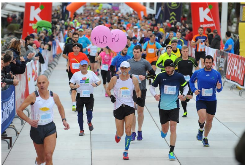
Slika 19. Splitski maraton