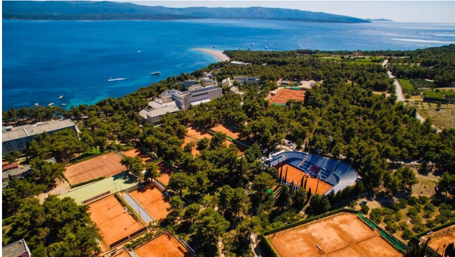
Slika 17. Teniski tereni u Bolu