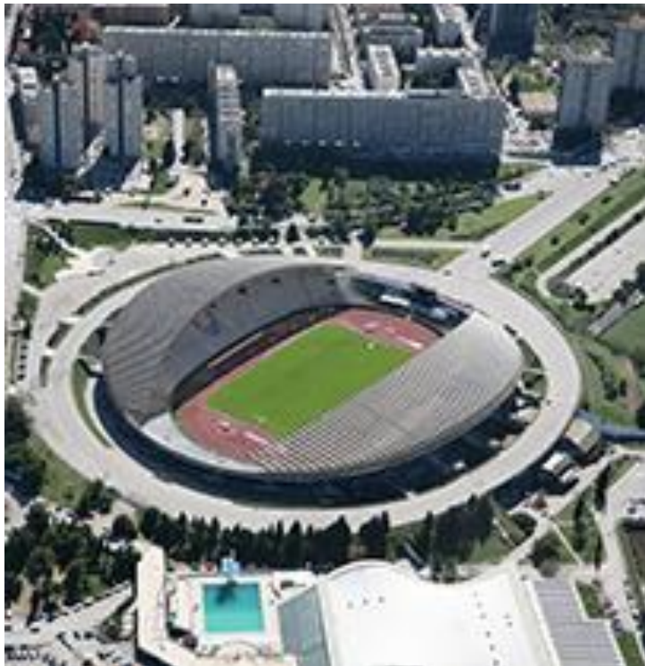
Slika 5. Stadion Poljud