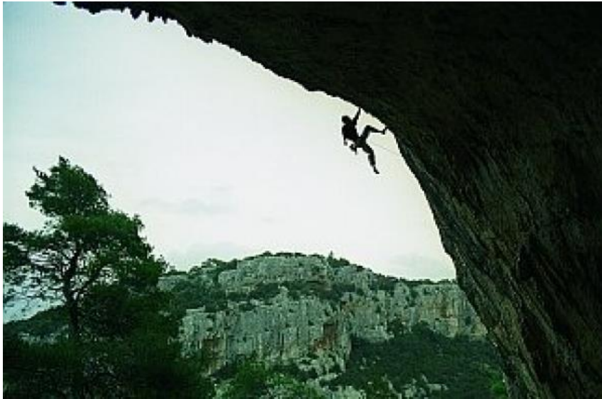
Slika 13. Slobodno penjanje