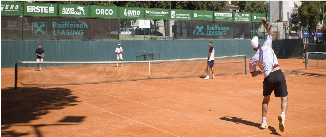
Slika 7. Teniski tereni Firule