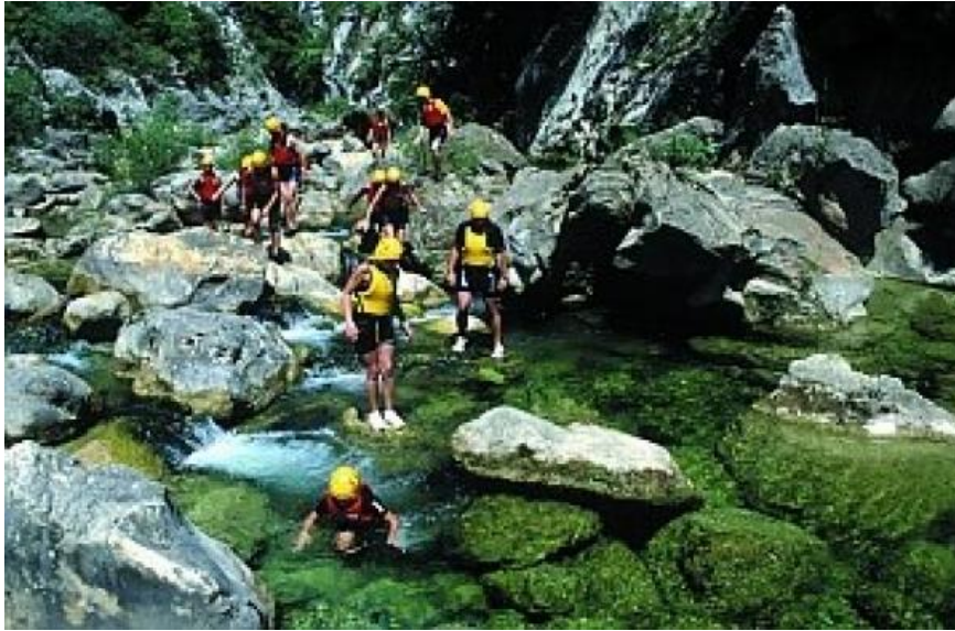
Slika 12. Kanjoning