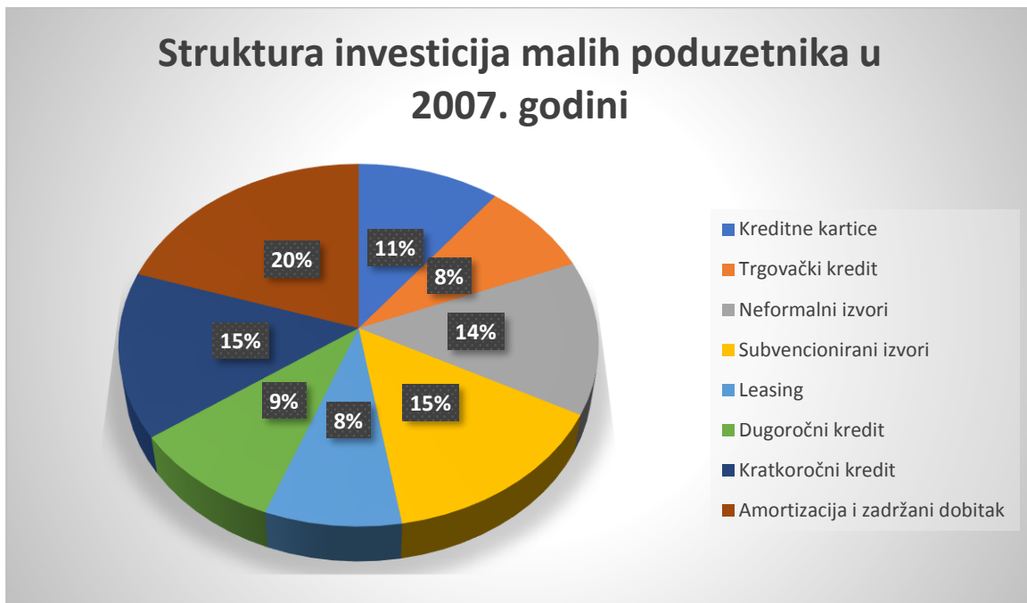
Grafikon 3. Financiranje investicija malih poduzetnika u 2007. godini