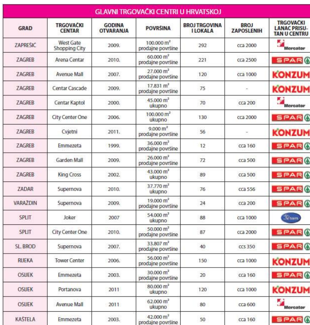
Slika 2 Glavni trgovački centri u Hrvatskoj