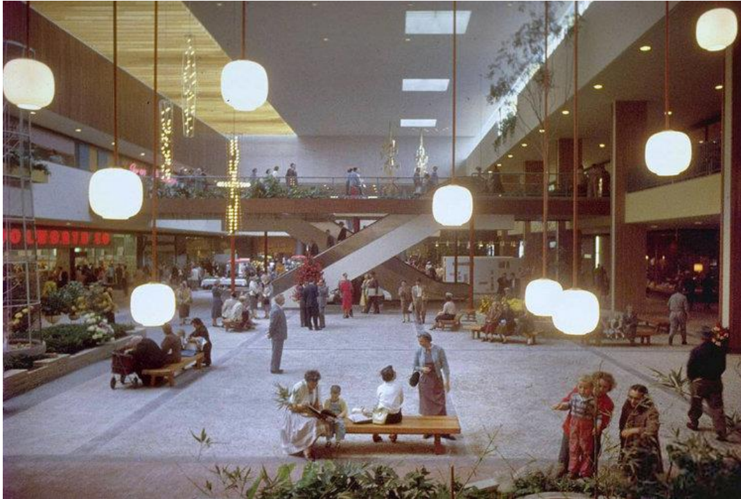
Slika 1 Southdale Center, Minnesota