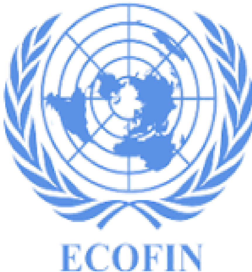
Slika 3. ECOFIN