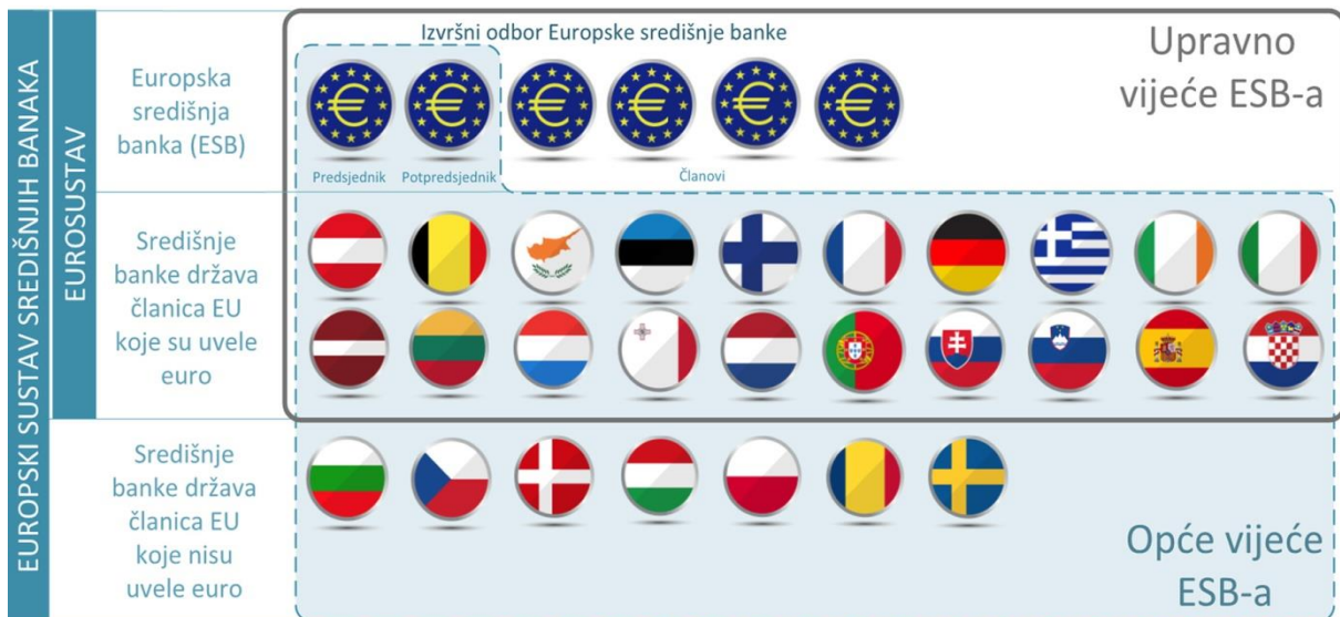
Slika 2. Europska središnja banka, Eurosustav i Europski sustav središnjih banaka i tijela za odlučivanje