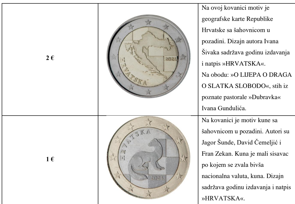
Tablica 3. Hrvatske eurokovanice

Hrvatska je odabrala četiri prijedloga dizajna nacionalne strane eurokovanica koji sadržavaju motive sa hrvatskom šahovnicom u pozadini te je na svim kovanicama prikazano 12 zvijezda europske zastave.