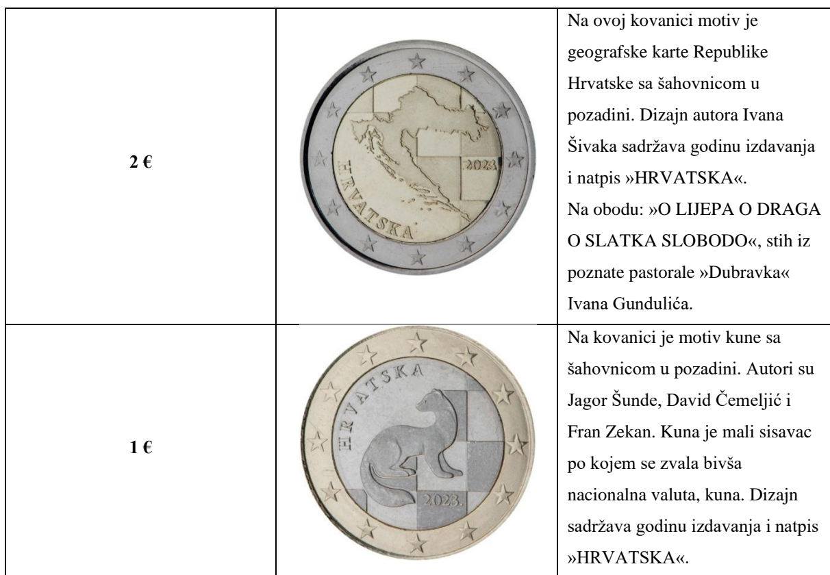
Tablica 3. Hrvatske eurokovanice

Hrvatska je odabrala četiri prijedloga dizajna nacionalne strane eurokovanica koji sadržavaju motive sa hrvatskom šahovnicom u pozadini te je na svim kovanicama prikazano 12 zvijezda europske zastave.