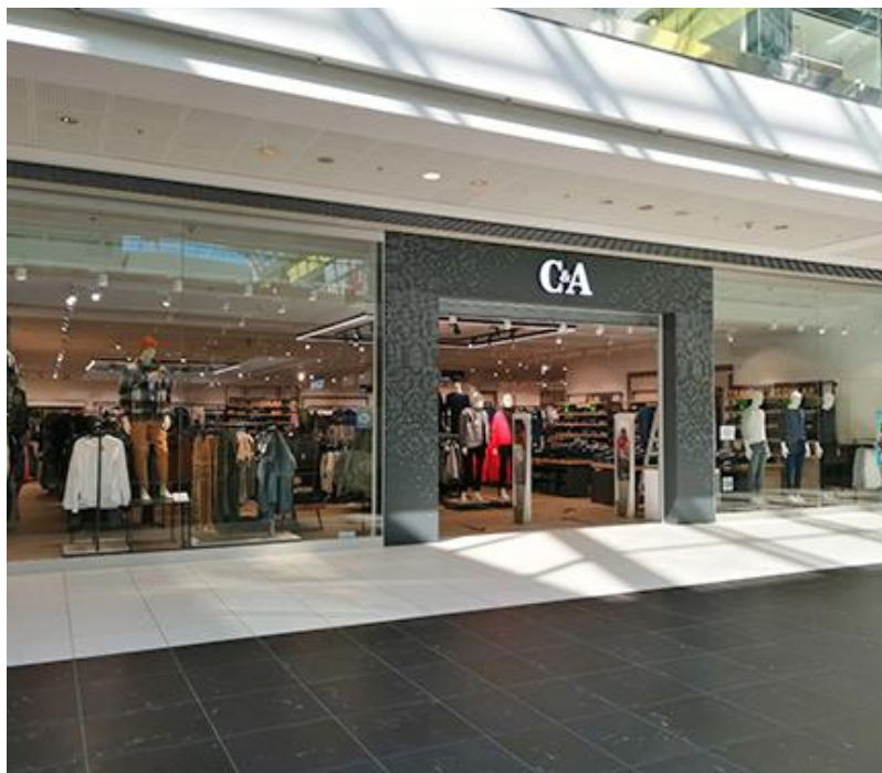
Slika 6 - Prikaz poslovnice C&A moda d.o.o.

C&A moda d.o.o. bilježi uspješno poslovanje već godinama, te ima ponudu pristupačne odjeće najnovijih modnih stilova. Rade na tome da u osnovnu ponudu uvijek dodaju neki novi komad pri tom prateći trendove. Tvrtka ima 1575 poslovnica diljem Europe, te djeluje već 176 godina s ciljem da uvijek izrađuju odjeću koja će uvijek biti široko dostupna. Svakodnevno imaju preko dva milijuna kupaca i oko 60 tisuća zaposlenika, te više od milijun dobavljača koji proizvode odjeću za sve te poslovnice.