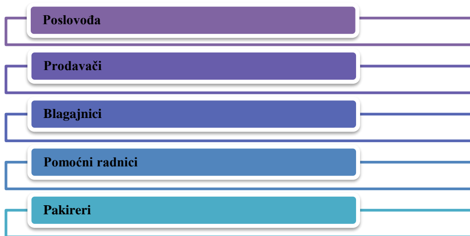
Slika 1 - Prikaz osnovnih radnih mjesta poduzeća

Broj, struktura, odnosno karakteristike prodajnog osoblja ovise prije svega o veličini poslovnice i ponudi asortimana koju ista ima. Logično je kako će manja poslovnica imati manje djelatnika, nego li neka veća, ali kao osnovna radna mjesta maloprodaje razlikujemo određene kadrove prodajnog osoblja (Slika 1.). 1