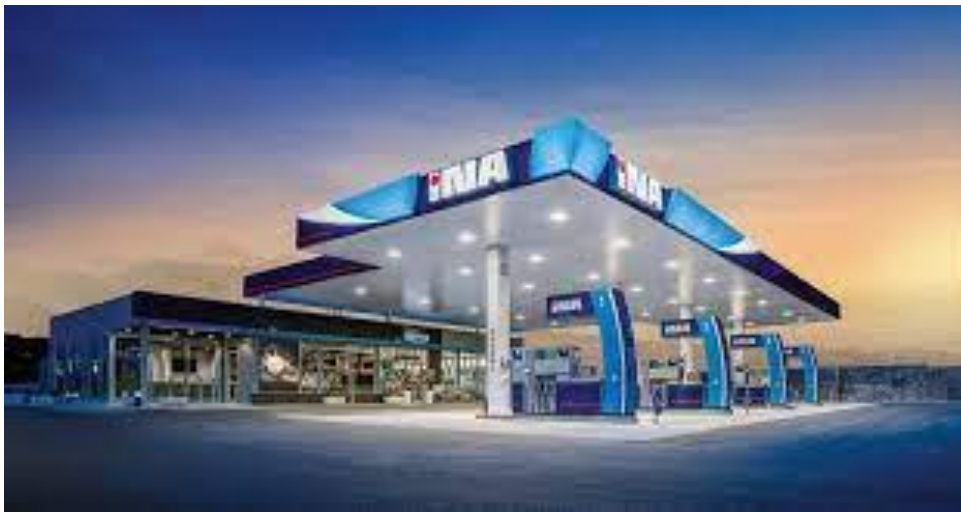
Slika 8 - Prikaz poslovnice Ina d.d.

Ina d.d. je srednje velika europska naftna kompanija koja ima vodeću ulogu u naftnom poslovanju u Hrvatskoj, te značajnu ulogu u regiji, u smislu istraživanja i proizvodnji nafte, plina, preradi nafte, te distribuciji nafte i naftnih derivata. Dioničko društvo osnovano je 01.01.1964. godine spajanjem Naftoplina s rafinerijom u Rijeci i Sisku. Ina je dioničko društvo čiji su najveći dioničari naftna kompanija Mol, Republika Hrvatska, a manji dio dionica nalazi se u vlasništvu privatnih institucionalnih investitora. Sjedište društva nalazi se u Zagrebu. Ukupan broj zaposlenih je nešto manji od 10.000. Osim u Hrvatskoj Ina posluje u Angoliji i Egiptu. Ina upravlja modernom regionalnom mrežom više od 500 maloprodajnih mjesta u Hrvatskoj i susjednim državama. Nastojeći energiju učiniti dostupnom Ina želi biti pokretač društvenog i gospodarskog razvoja. Vodeći brigu o ljudima i okolišu, njegujući odgovorno poslovanje i lokalno partnerstvo.