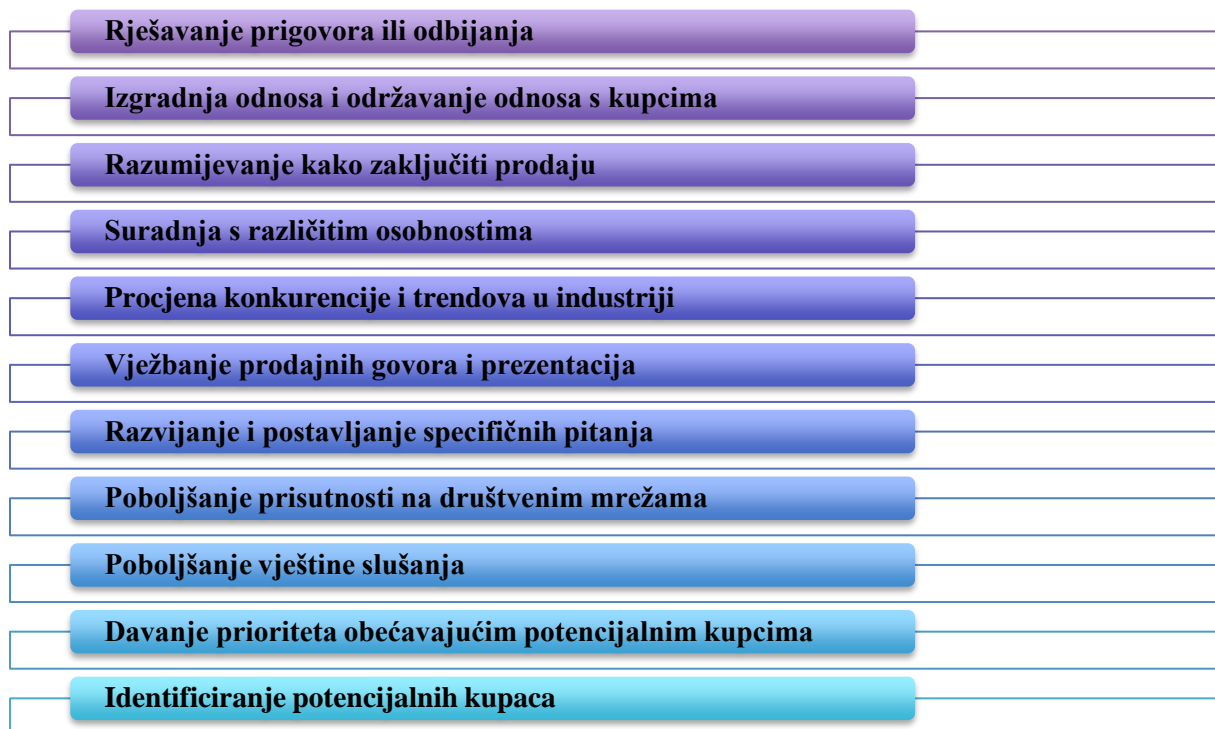
Slika 3 - Prikaz najčešćih tema edukacije prodajnog osoblja

Prilikom edukacije prodajnog osoblja, poduzeća provode razne programe kako bi poslovanje, ali i osposobljenost stručnog kadra bila na nivou, pa tako posebno provode razne edukacije prodajnog osoblja gdje se posebno ističe rješavanje prigovora, izgradnja odnosa s kupcima, zaključivanje prodaje, procjena konkurencije, poboljšanje vještina slušanja, identificiranje kupaca i sl. 16