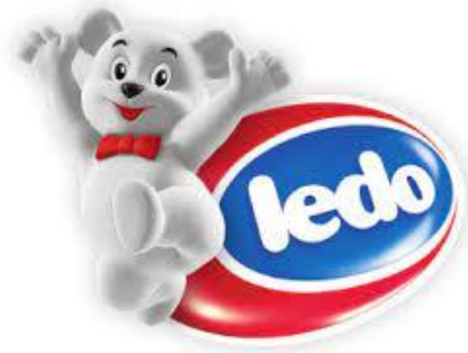
Slika 7 - Prikaz prepoznatljivog loga poduzeća Ledo plus d.o.o.

Ledo Plus d.o.o. je danas najveći domaći proizvođač industrijskog sladoleda, te najveći distributer smrznute hrane, koji se može pohvaliti širokim asortimanom proizvoda i to sladoledom, smrznutim voćem i povrćem, gotovim jelima i mesom, sa nadopunjavanjem novih inovativnih proizvoda koji odgovaraju visokim zahtjevima Ledovih potrošača. Prepoznatljiv i uvijek omiljen i vrlo popularan, Ledo osvaja svojom izvrsnom ponudom različitih proizvoda, te vrhunskom kvalitetom. Ledo uvijek radi na uvođenju moderne tehnologije i usavršavanja proizvoda, te konstantno zadržava najviše moguće standarde. Više od 500 hladnjača opremljenih tehnologijom osigurava da proizvodi stignu do prodajnih mjesta. Više od 100.000 rashladnih uređaja omogućuje da kupci u svakom trenutku mogu doći do svojih omiljenih smrznutih delicija. Zaštita okoliša jedan je od strateških ciljeva u poslovanju Leda. Ledo sa svojim zdravim proizvodima smrznute hrane zagovara zdrav život i pravilnu prehranu. Uvijek se brine da njegovi kupci i potrošači, te ostale zainteresirane strane budu zadovoljne i tako već više od pola stoljeća. Ledo također ima i svoj prepoznatljivi logo čiji su fanovi i veliki i mali.