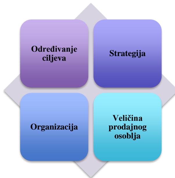
Slika 2 - Prikaz segmenata planiranja prodajnog osoblja

Kako bi kreirali efikasan prodajni sustav treba razmotriti nekoliko područja, a posebno se ističu određivanje cijena, strategija, organizacija, te veličina prodajnog osoblja (Slika 2.). 7