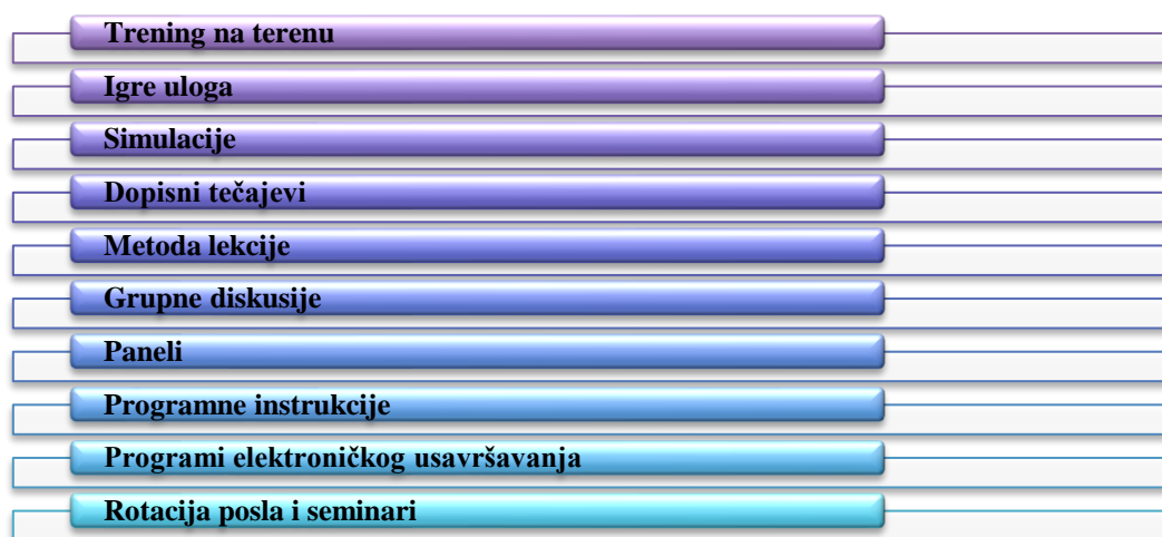
Slika 4 - Prikaz metoda obuke prodajnog osoblja

Kako bi prodajno osoblje bilo što osposobljenije za rad, a samim time i poslovni rezultati što bolji, poduzeća se odlučuju za različite metode obuke prodajnog osoblja, a posebno se ističu trening, igre uloga, simulacije, grupne diskusije, paneli, rotacija posla, te razni programi električnog usavršavanja. 21