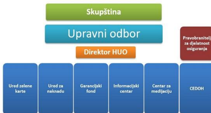
Slika 3 Tijela upravljanja