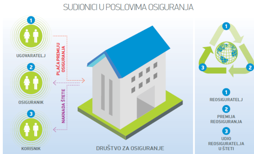
Slika 1 Sudionici u poslovima osiguranja