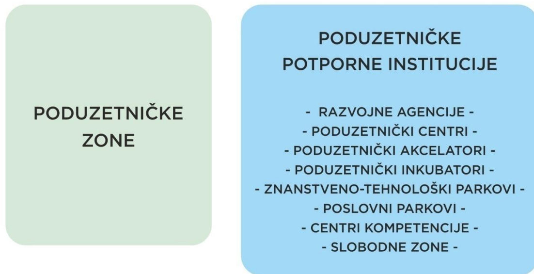
Slika 5. Poduzetnička infrastruktura u Republici Hrvatskoj

Razvojni program poduzetničke infrastrukture zahtjeva ulaganje u nove institucije, ali i u postojeće, kako bi se zadovoljile poduzetničke potrebe, bez obzira radili se o savjetodavnim ili nekim drugim.