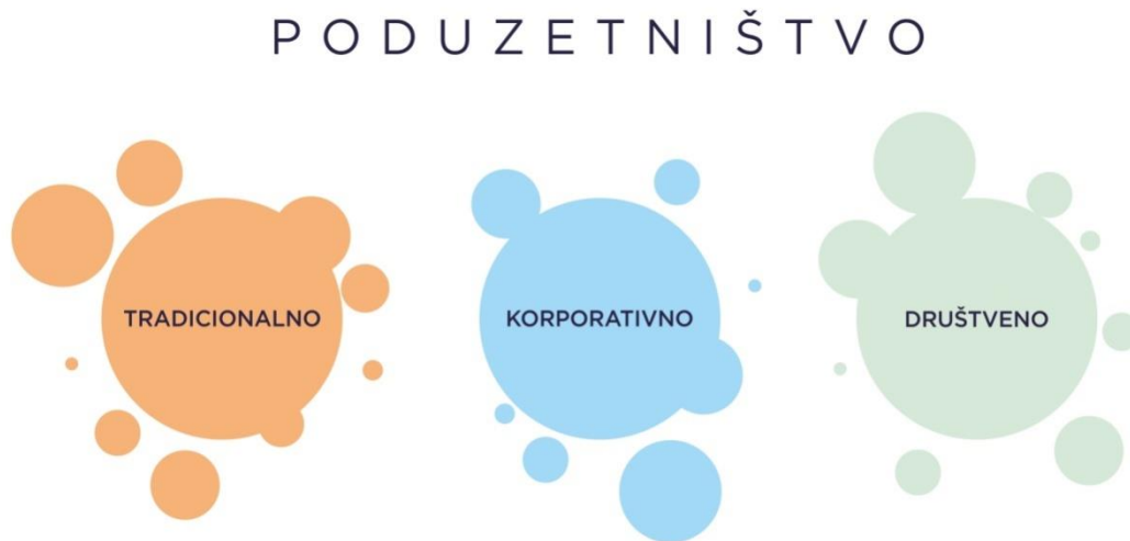
Slika 1. Tri oblika poduzetništva

Tradicionalno poduzetništvo definira se kroz mala i srednja poduzeća čiji profit proizlazi iz inovativnih metoda s razumnim rizikom, provodeći aktivnosti koje vode realizaciji cilja, uz poduzimanje raspoloživih mjera s preuzimanjem odgovornosti za ostvarenje vizije. 5