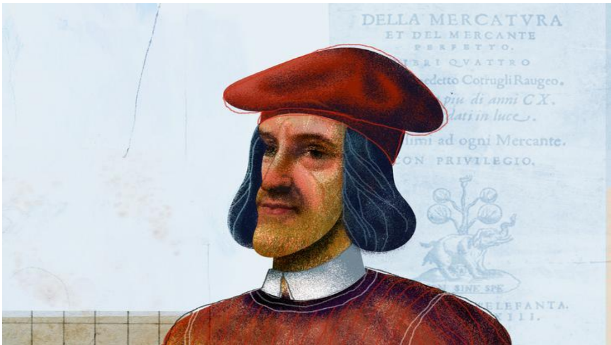
Slika 2. Benedikt Kotruljević