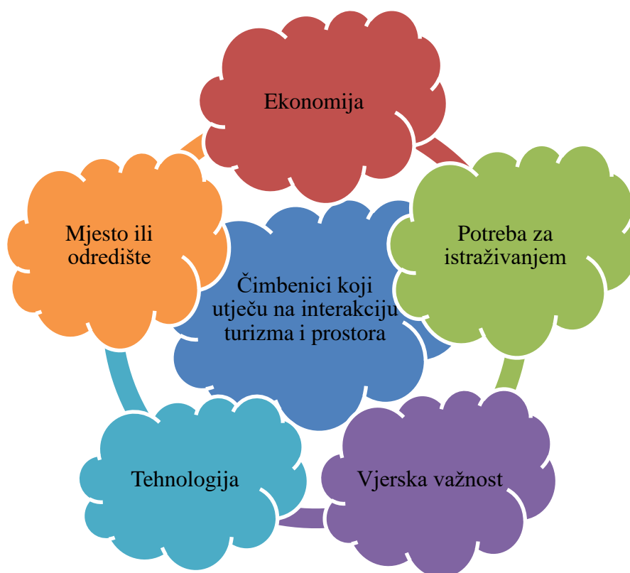
Slika 2. Čimbenici koji utječu na interakciju turizma i prostora

Uređeni prostor dovodi ili odvodi posjetitelje te o ukupnom čovjekovom okolišu ovisi prihvaćenost na turističkom tržištu. Turizam je u svom najboljem obliku kada određite ima povoljnu klimu. Suprotno tome, sve neželjene promjene u okolišu i vremenu kao što su jaki vjetrovi, poplave, suša i ekstremna klima mogu negativno utjecati na turizam.