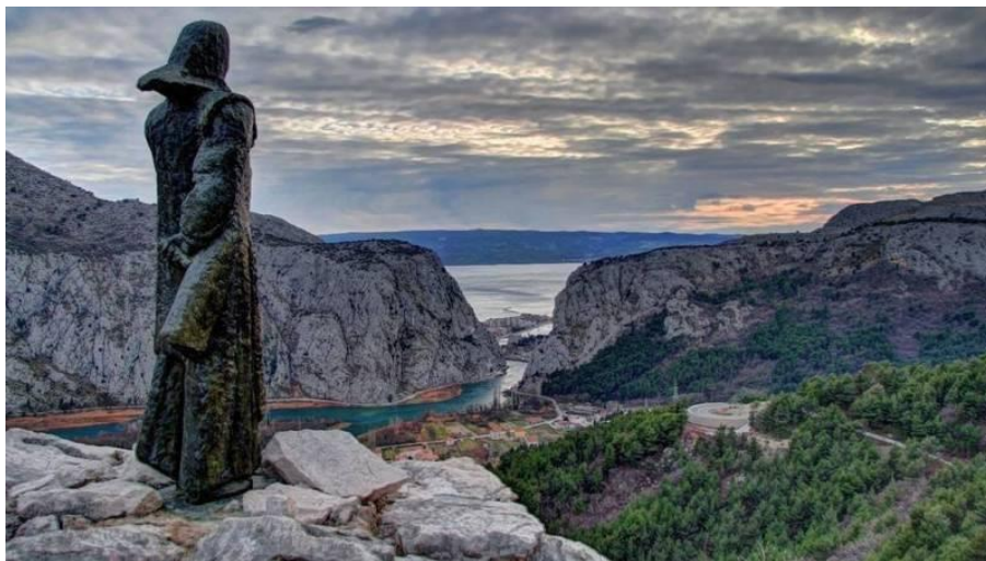
Slika 12. Kip junjakinje Mile Gojsalić

Zavevši pašu, ušuljala se u spremište baruta turske vojske i zapalila ga. Osmanlije su Milu pokušali uhvatiti, ali, kao svaka prava junakinja, ona nije mogla dopustiti da padne u ruke neprijatelju. S turskom vojskom za leđima, hrabro je trčala do litice s koje puca veličanstven pogled na ušće Cetine te skočila u smrt. Ohrabreni junaštvom Mile Gojsalić, Poljičani su krenuli u protunapad i jednom zauvijek protjerali Osmanlije iz svoje republike.