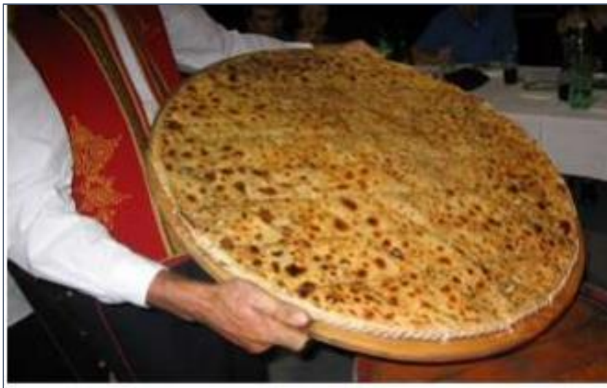
Slika 13. Poljički soparnik

Poljički soparnik je tradicijski pekarski proizvod koji je izrađen od pšeničnog brašna, blitve, luka, maslinovog i suncokretova ulja, češnjaka, soli i vode. Poljički soparnik je hrvatski prehrambeni proizvod koji je dobio zaštićenu oznaku zemljopisnog podrijetla na razini EU-a. 32 Poljički soparnik potječe iz 16. stoljeća.