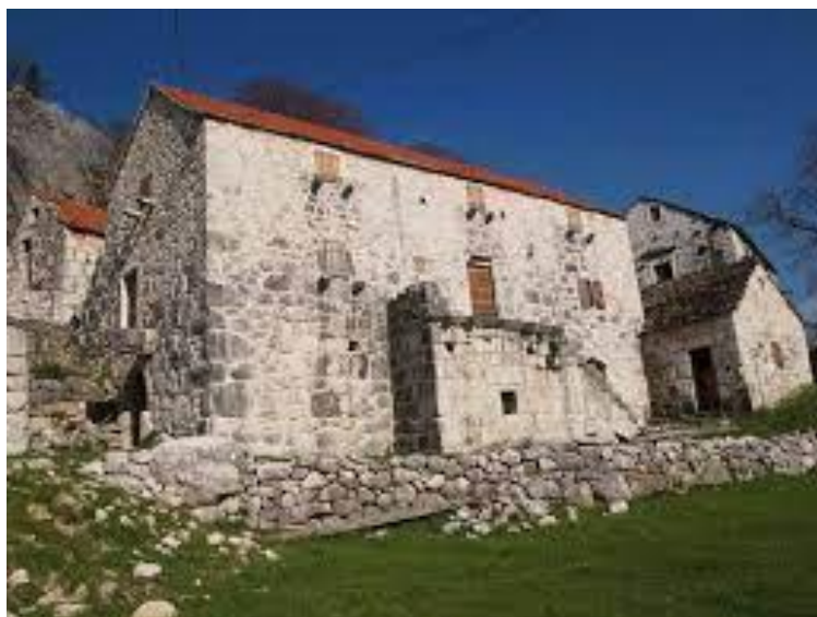
Tablica 1. Rodna kuća Mile Gojsalić