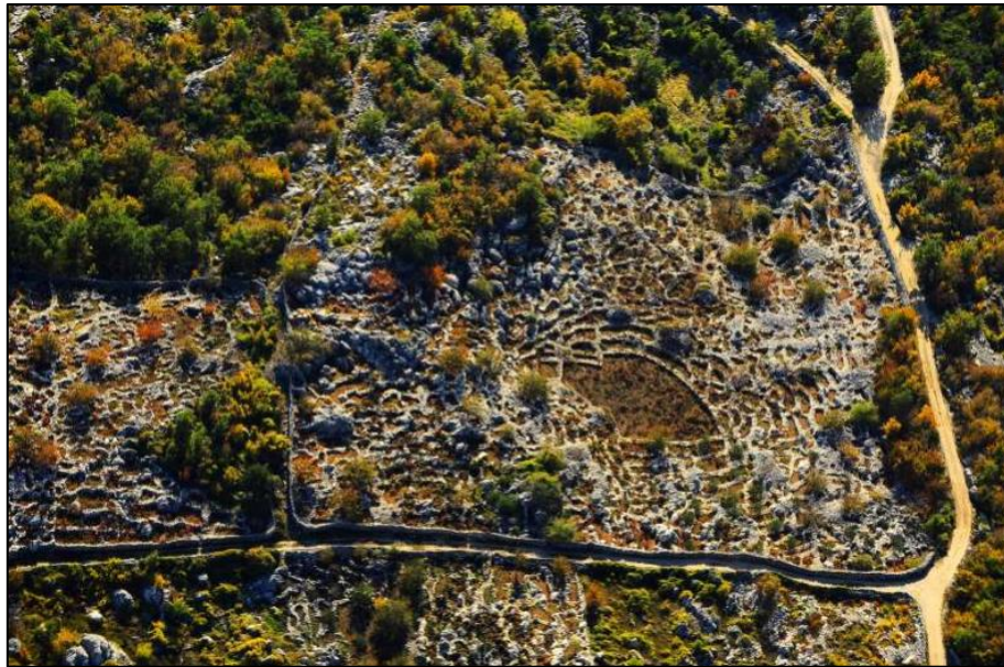
Slika 10. Kostanjsko-podgrajska ljuta, prostor iznimne pejzažne vrijednosti

Prostor Kostanjsko-podgrajske ljuti je prepoznat kao prostor razvojnog potencijala koji, oplemenjen dugoročno održivim turističkim sadržajima kao što je Interpretacijski centar Poljica u kombinaciji sa adrenalinskim parkom ili pustolovno-izletničkim centrom s tematskim stazama, može postati epicentar revitalizacije Poljica. 29