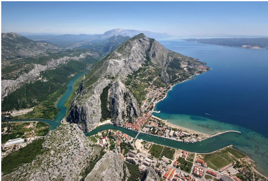
Slika 9. Ušće rijeke Cetine u Omišu

Cetina je rijeka pripada Jadranskom slivu, a nalazi se u Splitsko-dalmatinskoj županiji. Duga je 105 km i ulijeva se u Jadransko more kod Omiša. Cetina izvire na nadmorskoj visini od 385 m u sjeverozapadnim obroncima Dinare blizu sela Cetine, 7 km sjeverno od Vrlike. Ima više izvora, a glavni je izvor jezero duboko preko stotinu metara. Iznad izvora rijeke Cetine, sjeverno od Vrlike, nalazi se Gospodska pećina, znamenita po naseljenosti u prapovijesnom dobu.