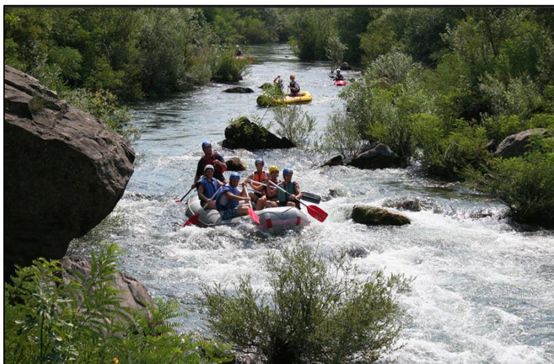
Slika 11. Rafting na Cetini

Tijekom ljetne turističke sezone, u donjem toku Cetine (od Slimena do Radmanovih mlinica kod Omiša), svakodnevno se dva puta dnevno u trajanju od 3 do 4 sata odvija rafting. Vožnja kanuima na rijeci Cetini izvrsna je aktivnost za sve posjetitelje koji se žele zabaviti i uživati u netaknutoj prirodi. Kanjon rijeke Cetine, kojeg većim dijelom okružuje Poljica, omiljeno je odredište avanturista u potrazi za penjanjem po stijenama, raftingom, planinarenjem i kanjoningom.