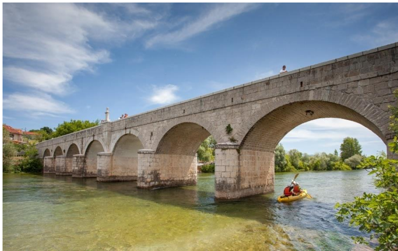
Slika 6. Pavića most

Pavića most je jedan od najstarijih mostova preko rijeke Cetine između Podgrađa i Slimena koji je sagrađen 1900. godine, a, kameni most je u upotrebi i danas. Godine 2012. nakon opsežnih radova dodatno je učvršćen i obnovljen te je mostom danas moguće proći i automobilom.