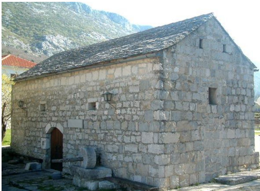
Slika 5. Muzej poljica

Stara ranokršćanska crkva danas svjedoči o bogatom životu u Poljicima još od antičkih vremena, a u Povijesnom muzeju Poljica pronaći ćete vrijednu povijesnu zbirku iz koje možete naučiti nešto više o poljičkoj kulturi i svakodnevnom životu starih Poljičana. Muzej Poljica sadrži niz izložaka koji podsjećaju na dane poljičke autonomije. Svi predmeti iz muzeja su autentični i izvorni, a uglavnom se radi o donacijama sumještana. Muzej je otvoren 04. svibnja 1974. godine na inicijativu don Frane Mihanovića koji je jedna od važnijih osoba poljičke povijesti.