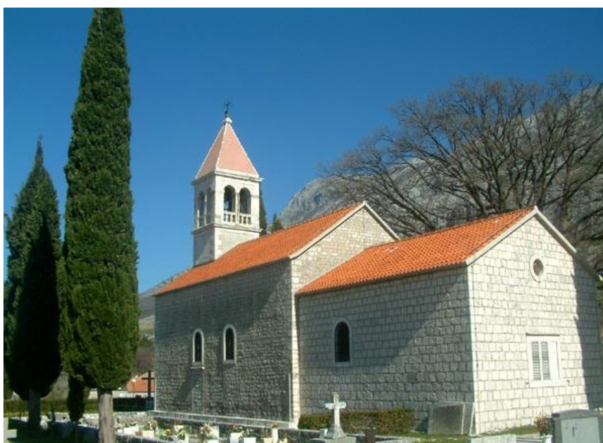
Slika 7. Župna crkva sv. Ciprijana

U novijem dobu, crkva sv. Ciprijana poznata je i po komemoraciji koja se održava svake godine 1. listopada u spomen poginulima u pokolju koji se dogodio 1942.