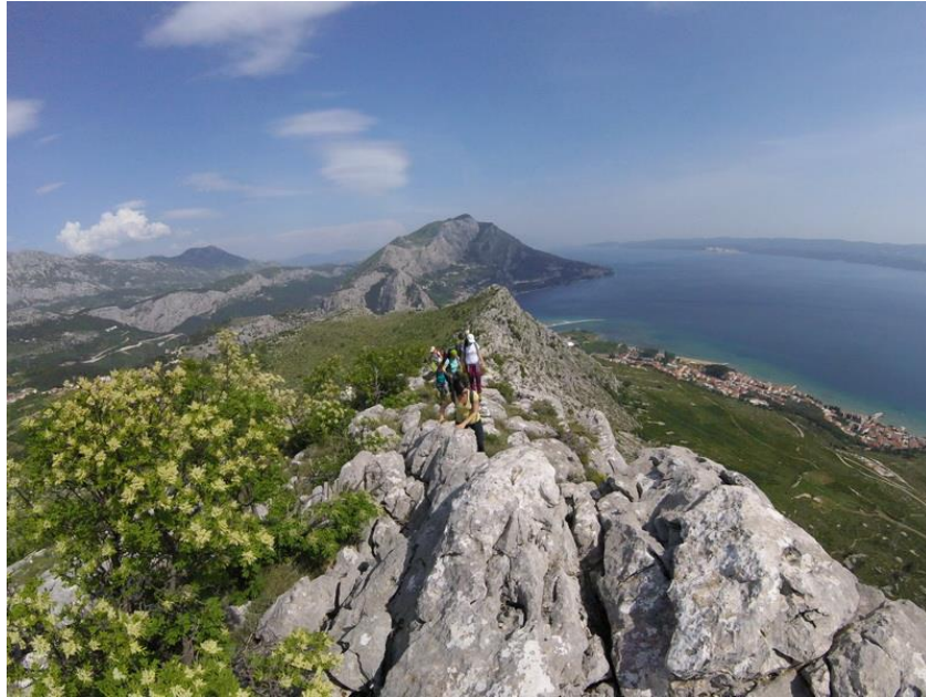
Slika 8. Poljička planina