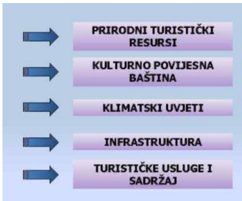
Slika 3. Odjela turističkih resursa prema WTO

Potencijal za razvoj turizma u bilo kojem području uvelike ovisi o dostupnosti rekreacijskih resursa, uz čimbenike poput klime, godišnjih doba, pristupačnosti, odnosa lokalnog stanovništva i planera turizma prema prirodi i opsegu razvoja turizma, postojećim sadržajima turističkog plana i stupnja do kojeg se mogu dalje razvijati u prevladavajućim ograničenjima prirodnog, kulturnog i financijskog okruženja.