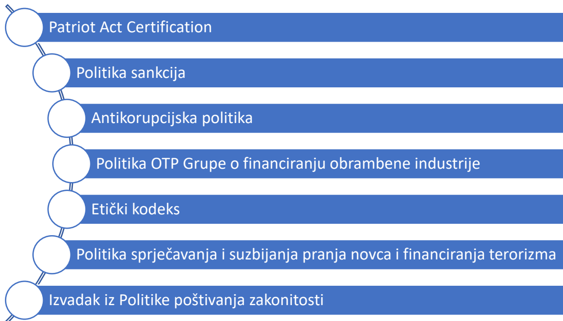
Slika 9. Poštivanje zakonitosti

svaka sadrži posebna načela i pravila kojima se trebaju voditi djelatnici banke ali i njihovi klijenti.