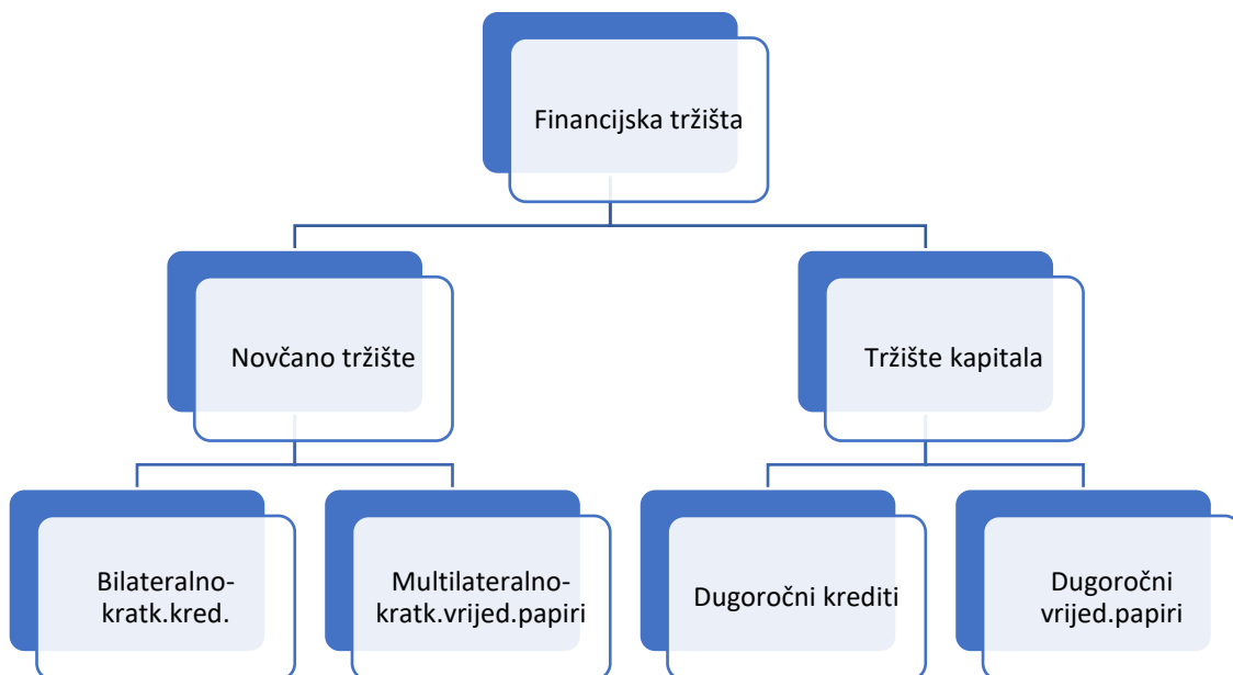
Slika 1. Podjela financijskog tržišta