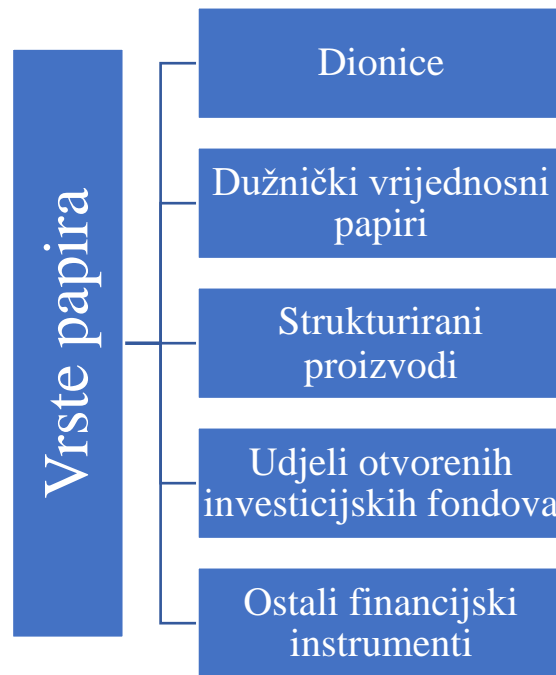
Slika 5. Vrste papira kojima se trguje na Redovitom tržištu