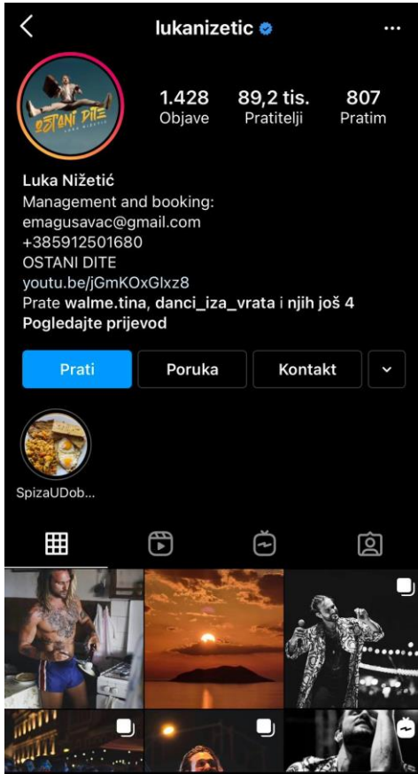
Slika 8: profil Luke Nižetića

Neki od segmenata koje su analizirali bili su: dob, spol i aktivnost pratitelja na društvenim mrežama.