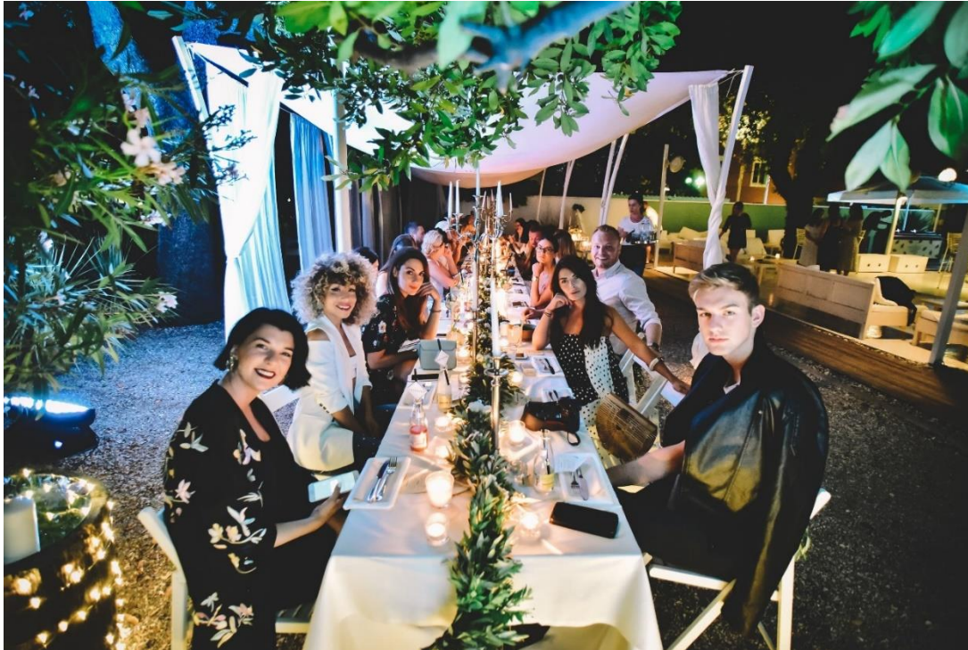
Slika 4: Večera u The Garden Lounge bar-u