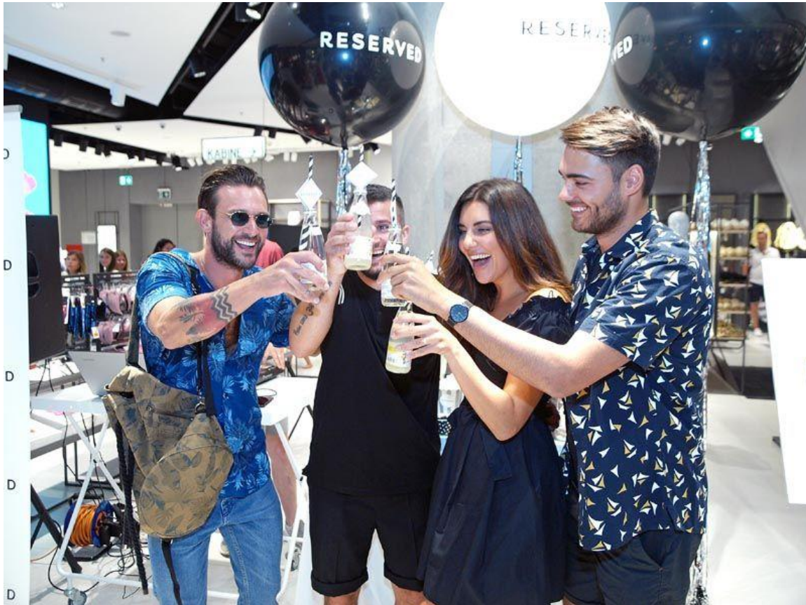
Slika 5: Druženje na otvorenju trgovine