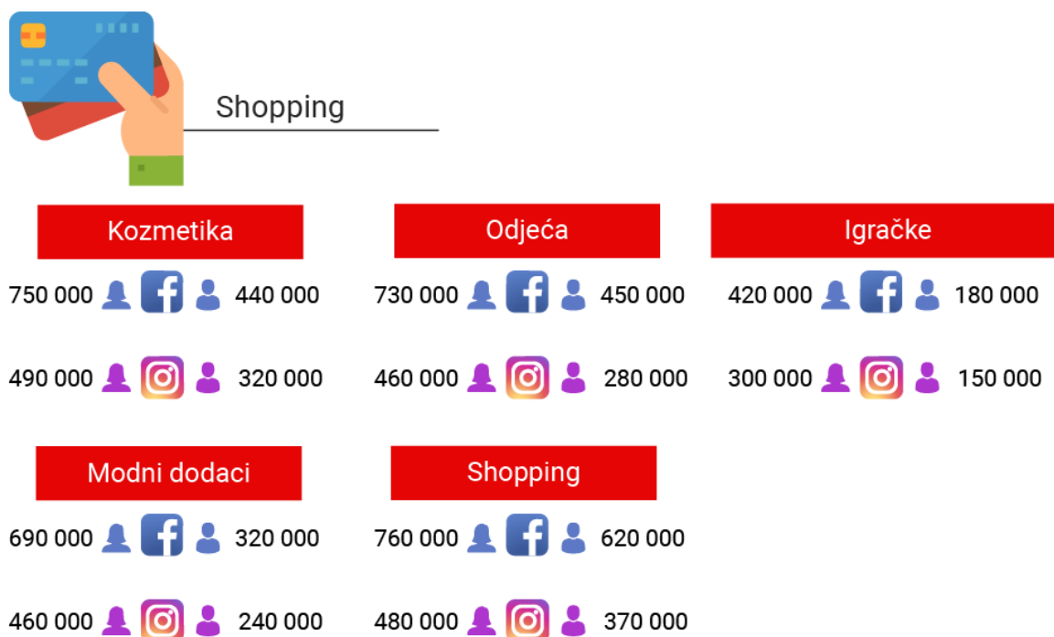
Slika 1 : Broj korisnika koji pretražuju pojmove vezane uz pojam "shopping"