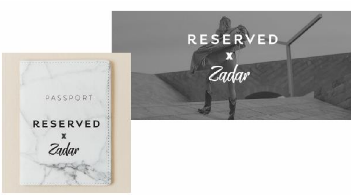
Slika 3: Druga opcija za dizajn događaja