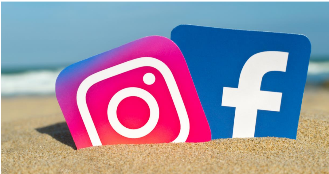
Slika 6: Alati za oglašavanje