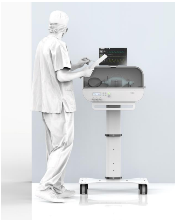
Slika 3.: Flow ventilator

"Vidjeli smo priliku da objedinimo našu stručnost u naprednom razvoju senzora, proizvodnji i našem globalnom lancu opskrbe kako bismo udovoljili kritičnoj i stalnoj potrebi za respiratorima za nuždu i pomogli da se napravi razlika u borbi protiv ovog globalnog virusa.", prenosi James Park, izvršni direktor Fitbit-a. 38