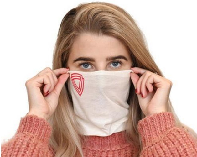
Slika 2.: Maska za lice tvrtke Virustatic Shield

Tvrtka Virustatic Shield jedan je od takvih primjera, tvrtka koja proizvodi maske za lice koje onemogućuju stranim tijelima da ulaze u čovjekov dišni sustav. S obzirom na izazove s kojima je medicina bila suočena, ovo je primjer uočavanja prilike na tržištu i nastanka inovacije koju je tržište prihvatilo. Radi se o višekratnim maskama za lice koje se mogu prati, pružaju dugotrajnu zaštitu od ulaska stranih mikroba u dišni sustav, omogućuju disanje bez naprezanja te prozračnošću omogućuju nesmetanu komunikaciju s drugom osobom. 36