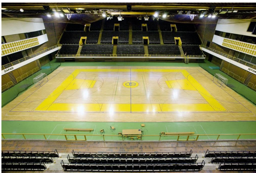
Slika 2. Sportska dvorana Gripe