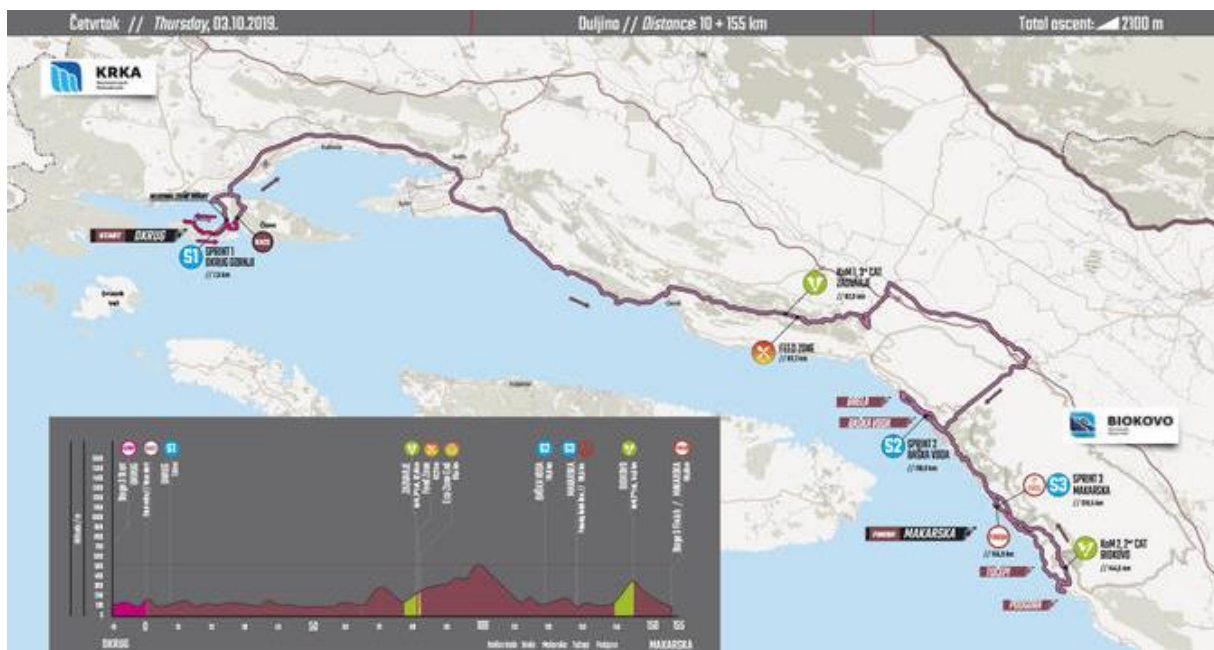
Slika 21. Etapa Okrug gornji-Makarska